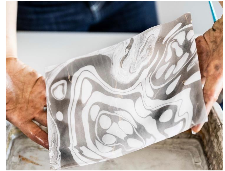
Atelier suminagashi, avec Emilie Hirayama

→ 24 créneaux disponibles pour les classes du territoire d'Est Ensemble