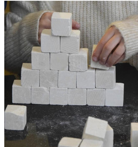
Pierre et taille de pierre, fond de dotation Verrecchia