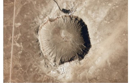
Doc. 4 Cratère dû à l'impact d'une météorite