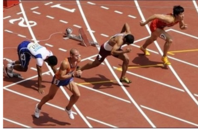
Doc. 3 Départ lors d'une course de 100 m