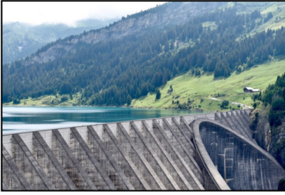
Doc. 2 Barrage hydroélectrique