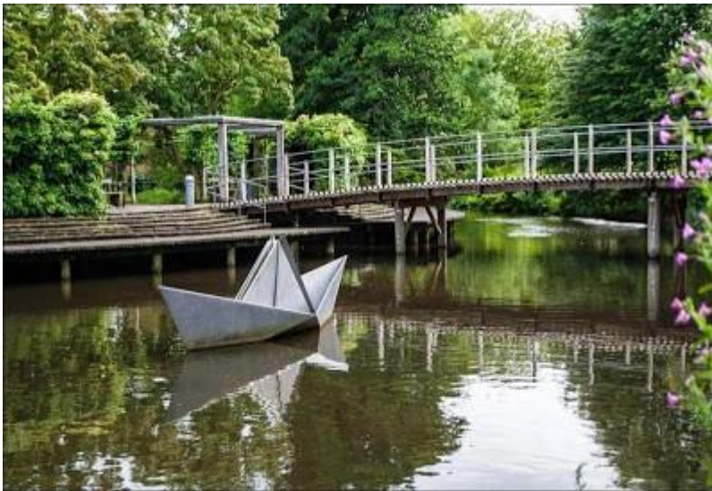
Памятник бумажному кораблику из кровельного железа. Где-то в Исландии.