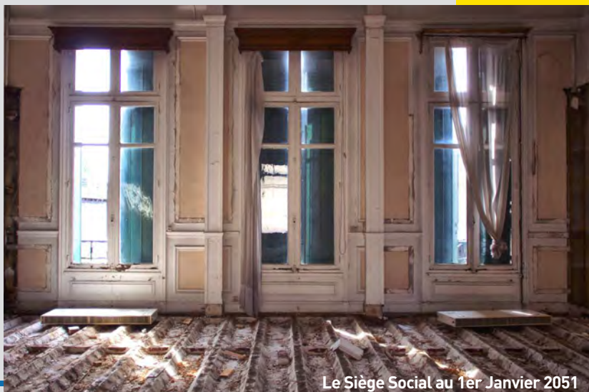
Le Siège Social au 1er Janvier 2051