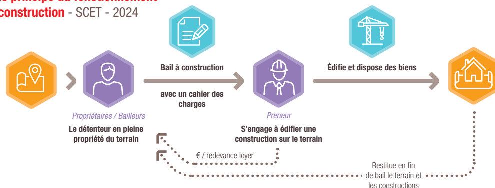
Schéma de principe du fonctionnement du bail à construction - SCET - 2024

La vision patrimoniale des dirigeants de TPE-PME constitue le principal frein à ces dispositifs. Ils souhaitent le plus souvent acquérir le foncier pour pouvoir en disposer librement et le céder ou le transmettre lors de la cessation de leur activité.