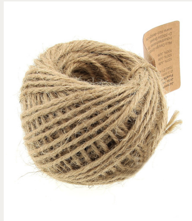
Fil de jute