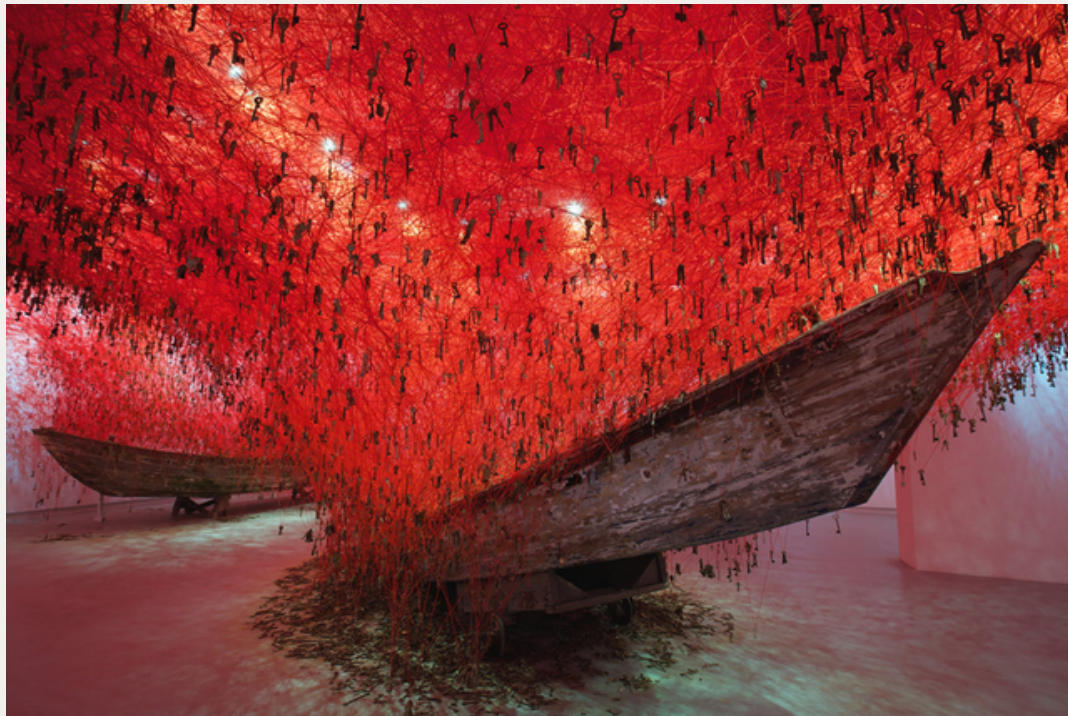
"the Key in the Hand", Chiharu Shiota