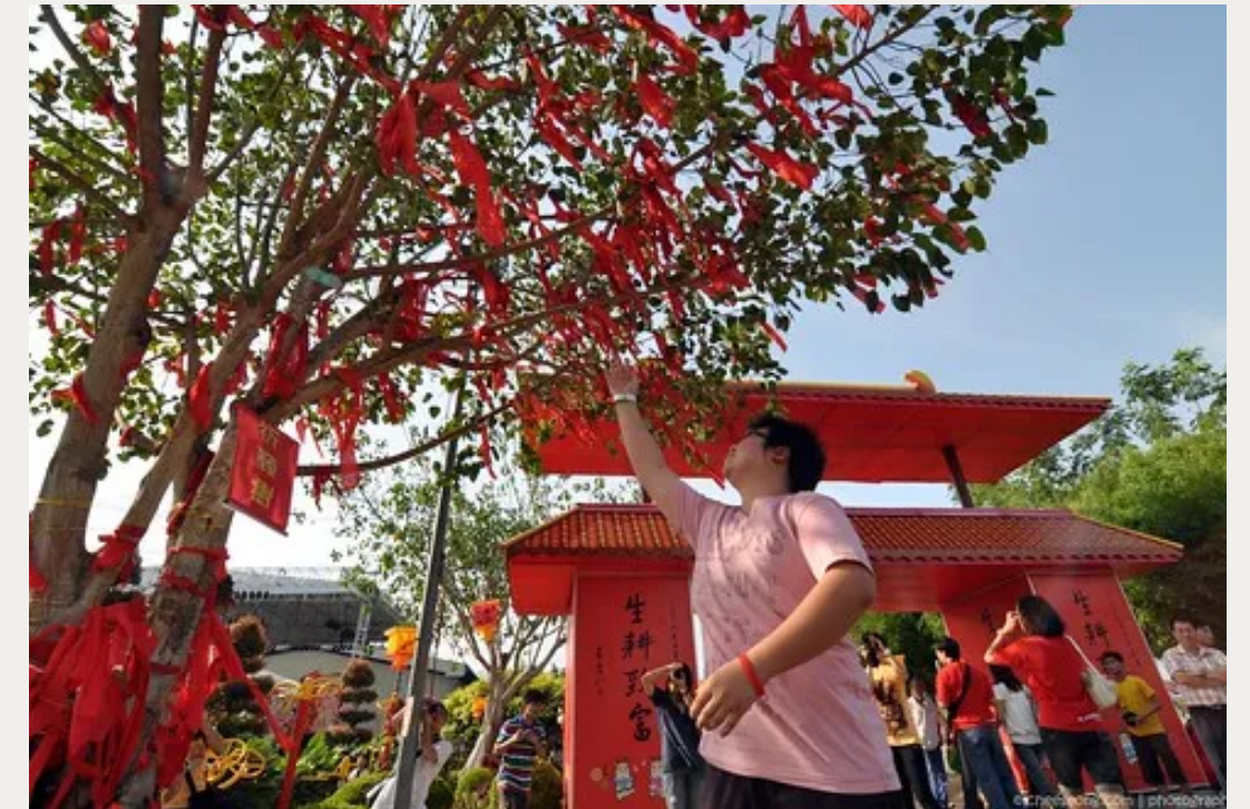
les arbres à voeux chinois