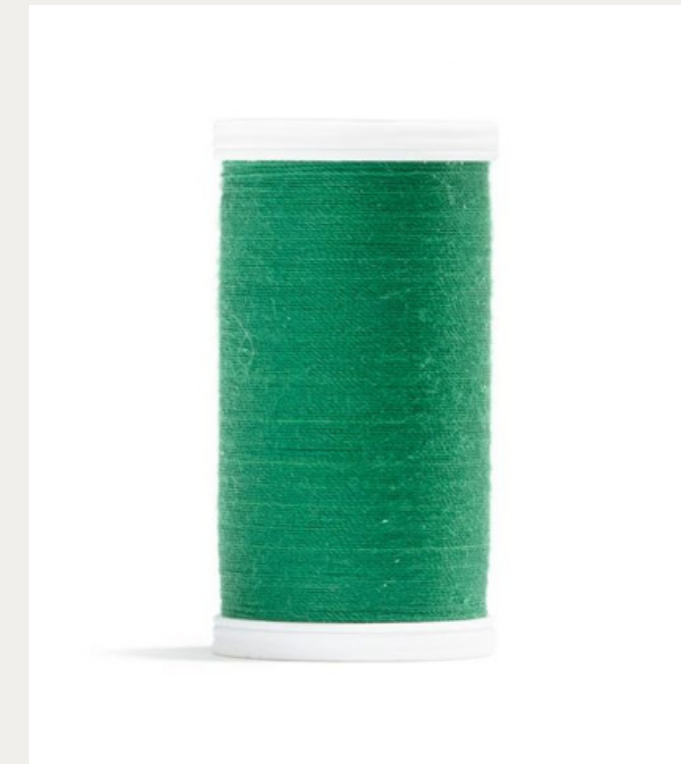
Fil de polyester vert