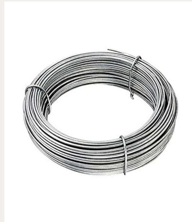
Fil de fer