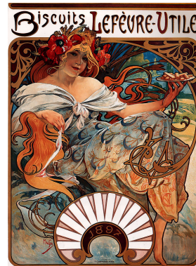
A. Mucha, Biscuits Lefèvre-Utile, 1896

1/Vous êtes graphiste et on vous demande de :