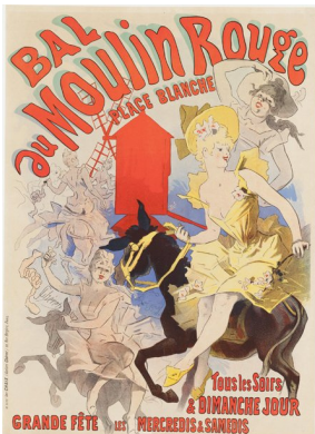
Chéret, Bal au Moulin Rouge, 1892

Ouvert à Paris en 1881, Le Chat Noir est considéré comme le premier cabaret moderne. Créée en 1896 par Théophile Steinlen , illustrateur Art Nouveau, cette affiche annonce la tournée des artistes du Chat Noir. Le cabaret fermera définitivement ses portes en 1897 après le décès de son propriétaire, Rodolphe Salis.