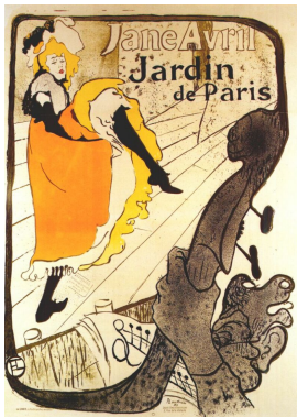
Toulouse-Lautrec, Jane Avril, Jardin de Paris, 1893