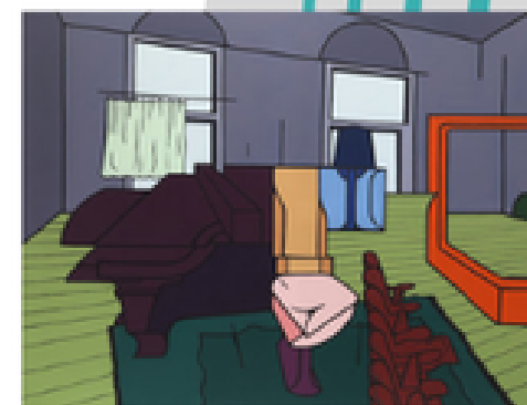
Valerio ADAMI, Interno con Pianoforte , Acrylique sur toile, 147 x 200 cm, 1968