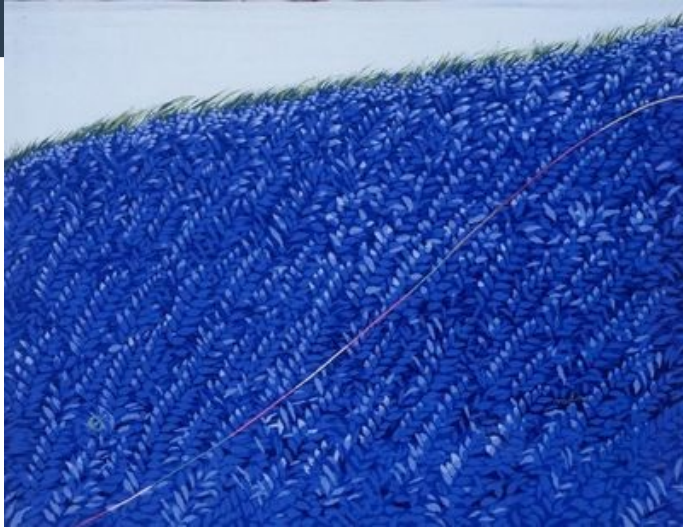
« Vent de Printemps dans l'après midi » Tapisserie de Milva Maglione