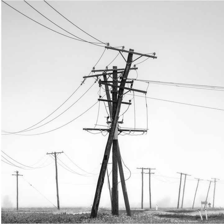
« X Power » , Photographie de Jannick Clausen