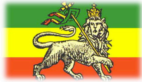
Ancien drapeau de l’Ethiopie utilisé dans la culture Rastafari

Compositeur et interprète : Bob Marley (1945-1981)