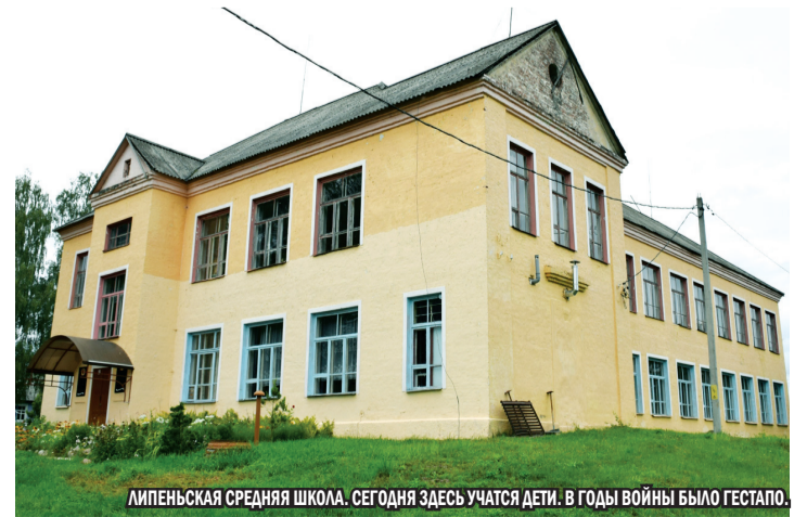
ЛИПЕНЬСКАЯ СРЕДНЯЯ ШКОЛА. СЕГОДНЯ ЗДЕСЬ УЧАТСЯ ДЕТИ. В ГОДЫ ВОЙНЫ БЫЛО GESTAPO.

Только в 1970-е годы на могиле жертв Холокоста в Липене на улице, названной в честь юной партизанки Риммы Кунько, поставили скромный бетонный обелиск с надписью «Жертвам фашизма 1941-1944 гг.» Однако абстрактное содержание надписи не указывало национальной принадлежности жертв и причины гибели людей. Памятник находится недалеко от места сожжения узников гетто на бывшем частном подворье, которое оказалось невостребованным (старый заброшенный дом в семидесятые годы сгорел, а наследники не объявились).