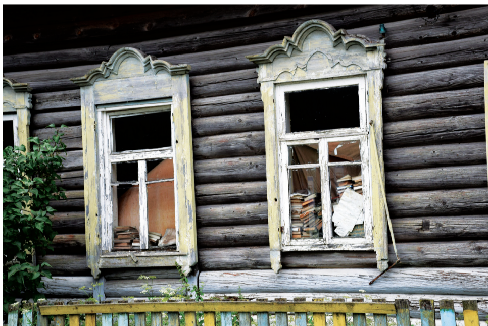
Бывший еврейский дом, в котором уже никто не живет.