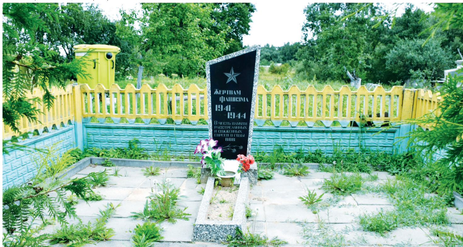
Памятник жертвам Холокоста в Липене. Обновлен в 2009г. за государственный счет.