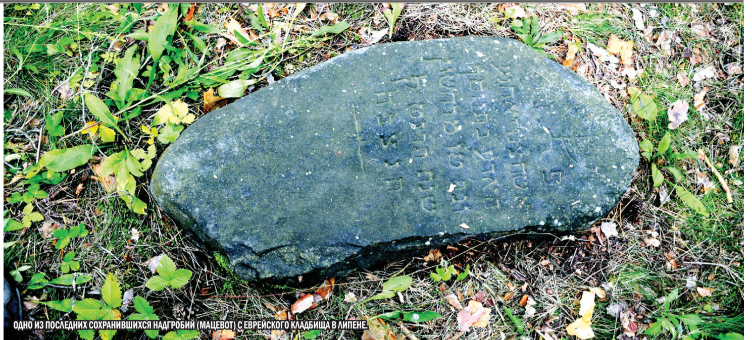
ОДНО ИЗ ПОСЛЕДНИХ СОХРАНИВШИХСЯ НАДГРОБИЙ (МАЦЕВОТ) С ЕВРЕЙСКОГО КЛАДБИЩА В ЛИПЕНЕ.

Я догадался, что в анонимном письме, оставленном у памятника жертвам нацистского геноцида в Липене, речь идет о коллективном покаянии потомка оккупантов. Большая часть современного населения Германии относит себя к христианам, а среди последних более половины – к протестантам. В 1950–1970гг. под влиянием осмысления тра-