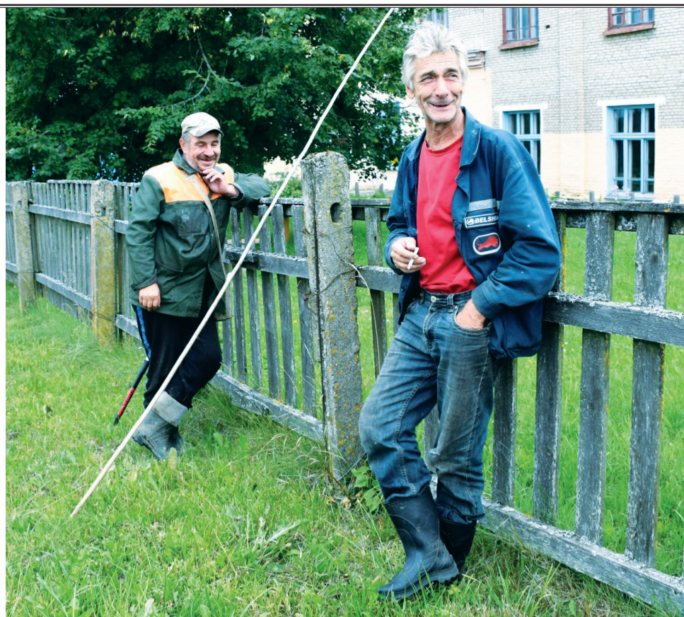
Липень сегодня. Жизнь продолжается без евреев.

Молодые мужчины и юноши призывного возраста получили повестки явиться в военкомат. Беженцы уходили в сторону Свислочи и Кличева. По свидетельству Софьи Павловны Лившиц, шло «много народу». По дорогам двигались военные машины, повозки и пешие. Солдаты бросали в пачках галеты (лепешки, хлебцы, печенье – часть сухого пайка). Переправились через р.Друть, добрались до Быхова. Кто успел перейти мост через Днепр, смог спастись. Мост скоро взорвали. Остальные жители вынуждены были возвратиться в Липень и оказались предоставлены самим себе («Война известная... и неизвестная». Сост. Н.А.Цыганок. Минск: БГАТУ, 2012г., с.297).