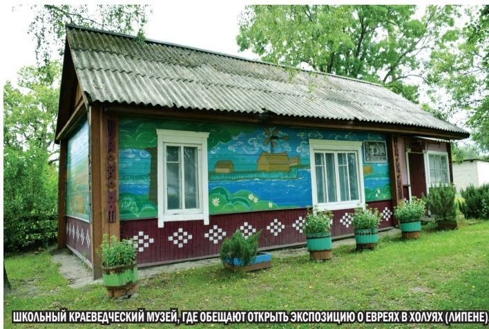
ШКОЛЬНЫЙ КРАЕВЕДЧЕСКИЙ МУЗЕЙ, ГДЕ ОБЕЩАЮТ ОТКРЫТЬ ЭКСПОЗИЦИЮ О ЕВРЕЯХ В ХОЛУЯХ (ЛИПЕНЕ).