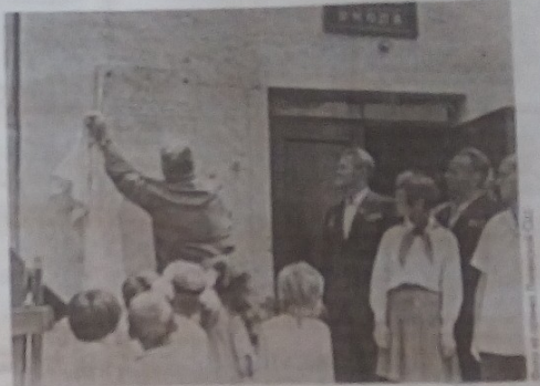
Торжественное открытие мемориальной доски в Липнянской СШ, 1973 год.

Нарядом, что отряд «Белый» состоит из специально отобранных бойцов, подготовленных для диверсионной работы по методикам главного дивизиона СССР майора НРДП Павла Савельева, так что члены им команду были отряд.