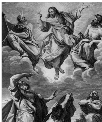
Trasfigurazione di Cristo con Profeti e Apostoli (Francesco Rosaspina 1762/ 1841)

animazione liturgico-musicale a cura della CAPPELLA MUSICALE DELLA CATTEDRALE DI MACERATA direttore: Carlo Paniccà