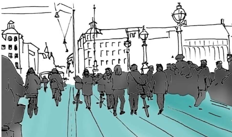
Illustration n° 4 : des espaces publics animés, à échelle humaine

Liens avec la démarche low-tech : La plupart de ces réflexions et de ces auteurs sont largement mobilisés par la pensée low-tech, voire en constituent ses fondements. Le questionnement systématique de la finalité, de la juste mesure des moyens engagés pour y répondre, l'humilité face au vivant, la critique d'une accélération forcée, d'une valorisation du tout technologique et la complexité croissante des outils et des structures. Elles questionnent également la taille des villes, les liens entre territoires, mais aussi l'échelle humaine , la topophilie (empruntée à Bachelard, 1957) autant d'éléments encore peu abordés dans la pensée low-tech.