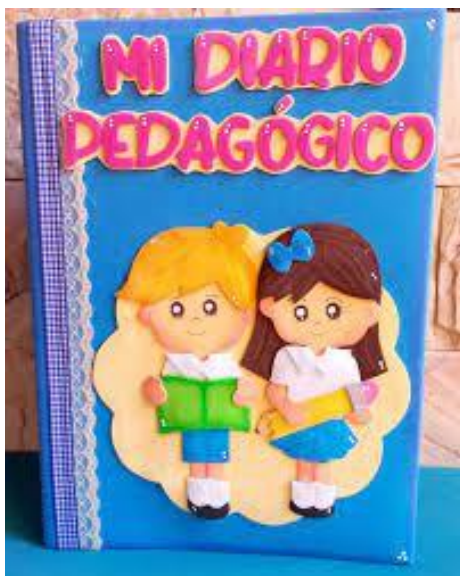
Ilustración 5: Diario pedagógico

Mientras interactúan entre ellos mismos en relación a las actividades, compartían opiniones, sueños, se ayudaban mutuamente y eso abre paso a la reflexión que es generada a través del diario pedagógico, pues se evidenciaba que estaban complementando, interactuando con su entorno y al tomar algo que ya tienen y aprender más sobre el mismo al interesarse, permite de esta manera un aprendizaje significativo para ellos en este proceso de desarrollo que están teniendo.