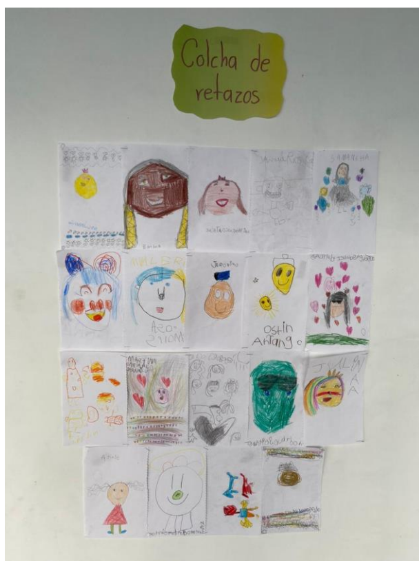
Ilustración 4: evidencias sobre colcha de retazos