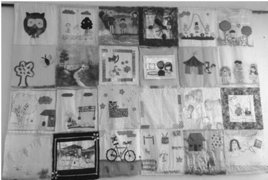
Ilustración 1: colcha de retazos

La variable a desarrollar es procesos cognitivos. Cada estudiante de Transición la llevará a cabo por medio de un dibujo.