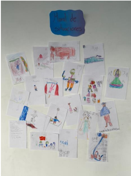
Ilustración 6: evidencias sobre mural de situaciones

investigador conocer el contexto y las situaciones en que se encuentran los estudiantes. Este se aborda de acuerdo a una situación referente a las profesiones, mediante esta actividad se obtiene una gran variedad de resultados de acuerdo a lo pedido, se observa creatividad, autonomía y dedicación. Algunas de las profesiones mencionadas fueron bombero, policía, docente y médico.