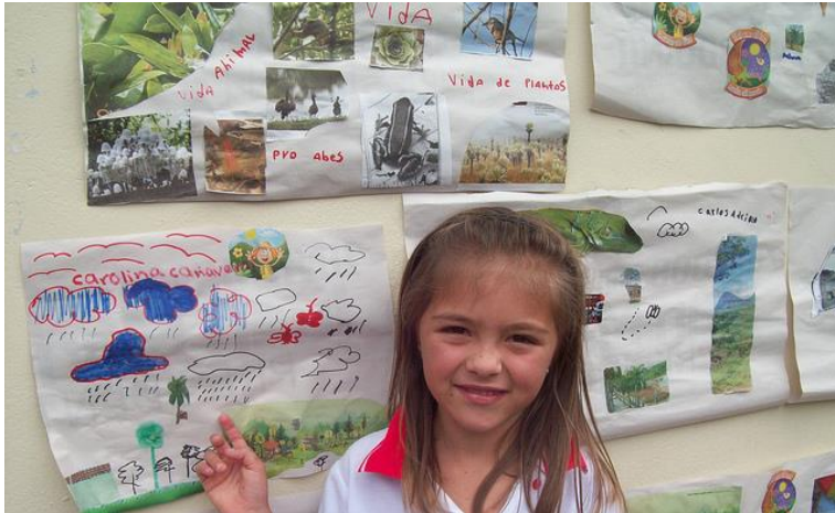
Ilustración 2: mural de situaciones

La variable a desarrollar es juego de roles.