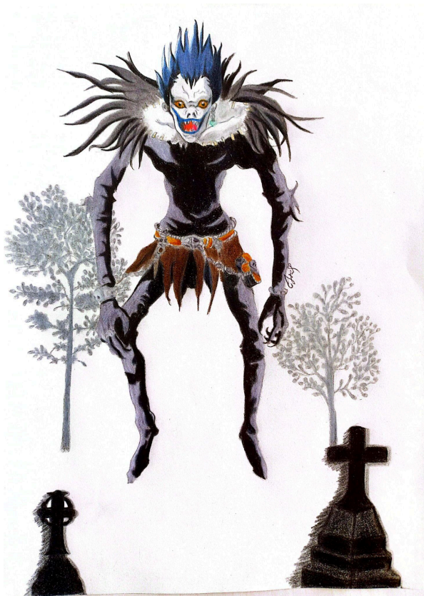
Ilustración de Isabella Saenz Agudelo.

TERCER COLOQUIO DE TRANSFORMACIÓN DEL QUEHACER EDUCATIVO 2024