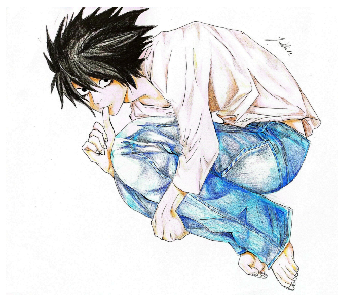
Ilustración de Juanita Mosquera Pérez.

L es un detective genial que enfrenta un dilema existencial mientras se dedica a capturar a Kira. Este dilema surge de la tensión entre su compromiso con la justicia y sus métodos poco convencionales. Su devoción a la justicia lo lleva a actuar de maneras que a veces