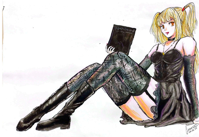
Ilustración de Mariana Gómez Velásquez.

Misa Amane, una reconocida modelo y actriz, enfrenta un dilema existencial al convertirse en la segunda Kira tras obtener su propio Death Note. Este dilema está profundamente ligado a su amor obsesivo por Light. Su identidad y decisiones están completamente moldeadas por esta devoción, llevándola a sacrificar su autonomía personal. Misa lucha por mantener su propia identidad mientras se somete a los deseos de Light, revelando el conflicto entre su autenticidad y su devoción amorosa.