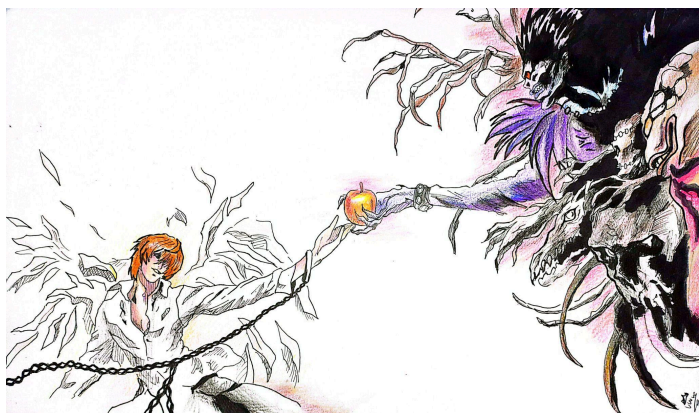
Ilustración de Salomé Ríos Aguirre.

Light Yagami, un destacado estudiante de secundaria, se enfrenta a un dilema existencial al descubrir el Death Note, un cuaderno que permite asesinar a cualquier persona cuyo nombre se escriba en él. Decidido a usarlo para erradicar a los criminales y crear un mundo mejor según su propia visión de justicia, Light se enfrenta a la inmensa responsabilidad y libertad que este poder le otorga. Su identidad se fragmenta entre ser Light, el estudiante, y "Kira", lidiando constantemente con la tentación del poder absoluto y las profundas consecuencias morales de sus acciones.