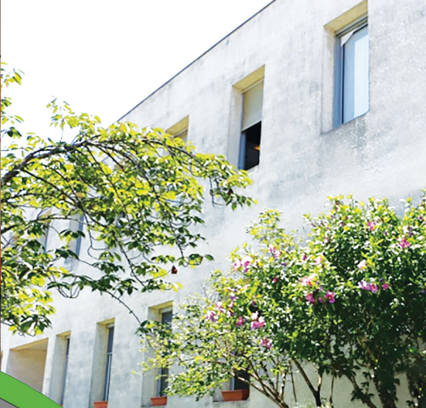
Ne pas jeter sur la voie publique Création graphique: BONIN Evan