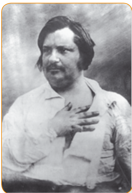
Portrait de Honoré de Balzac, 1842.

Dans cette biographie, nous allons mettre en valeur les liens entre la vie de l'écrivain et ce roman, ainsi que la place du Colonel Chabert dans son œuvre.