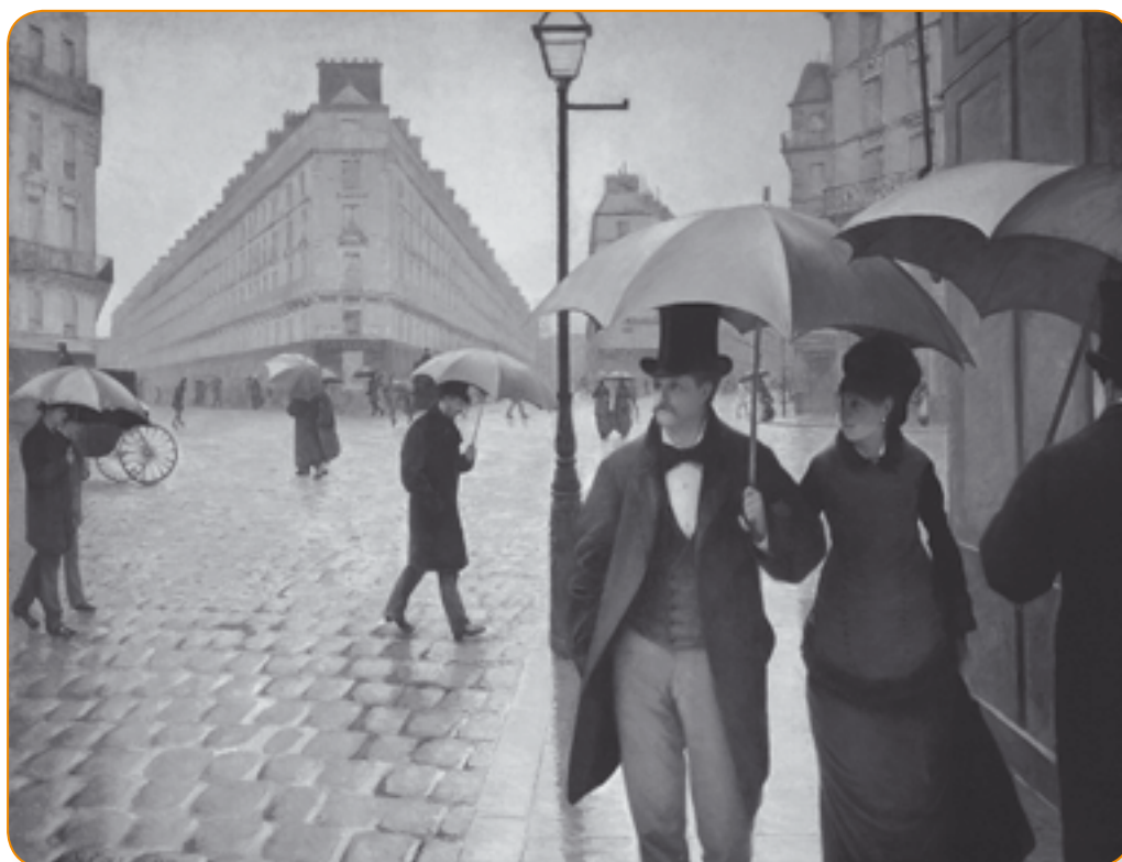
Gustave Caillebotte, Rue de Paris ; temps de pluie , 1877.

Exclu des beaux quartiers où il vivait autrefois, le colonel Chabert vit désormais dans un quartier pauvre de la périphérie. Son logis, tel le quartier où il se trouve, est miséreux et délabré. Dans les romans de Balzac, les lieux sont à l'image des personnages, les façonnant ou les révélant. Le colonel et la comtesse vivent ainsi dans des lieux opposés qui sont le reflet de leur mode de vie.