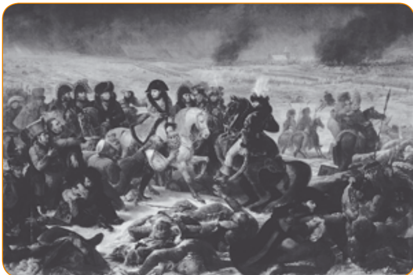
Antoine-Jean Gros, Napoléon 1 er sur le champ de bataille d'Eylau.

Comme nous l'avons vu dans les chapitres précédents, le colonel assiste à la ruine de l'Empire et à la disparition d'une certaine France. Lui qui a construit son identité et son existence pendant cette période et grâce à elle, ne parvient pas à revivre une nouvelle vie dans le nouveau monde qu'il découvre, dix ans après la bataille d'Eylau. La disparition de Napoléon et de celle de L'Empire ont signé son arrêt de mort, mort symbolique, certes, mais que le colonel, par lassitude et dégoût, va rendre réelle, en se retirant du monde.