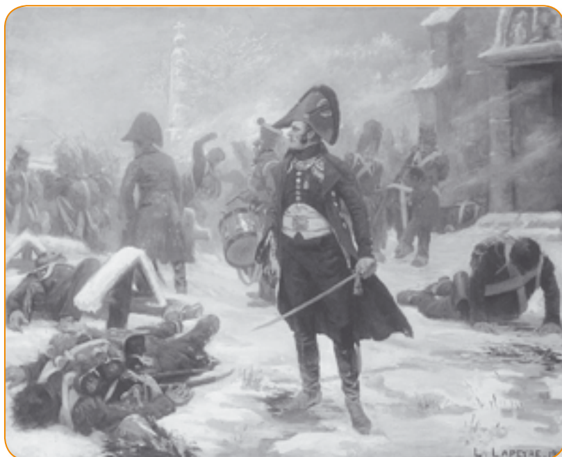
Lucien Lapeyre, François-Antoine Vizzavona, Le Capitaine Hugo à Eylau , 1807. (C) RMN / François-Antoine Vizzavona / Droits réservés.