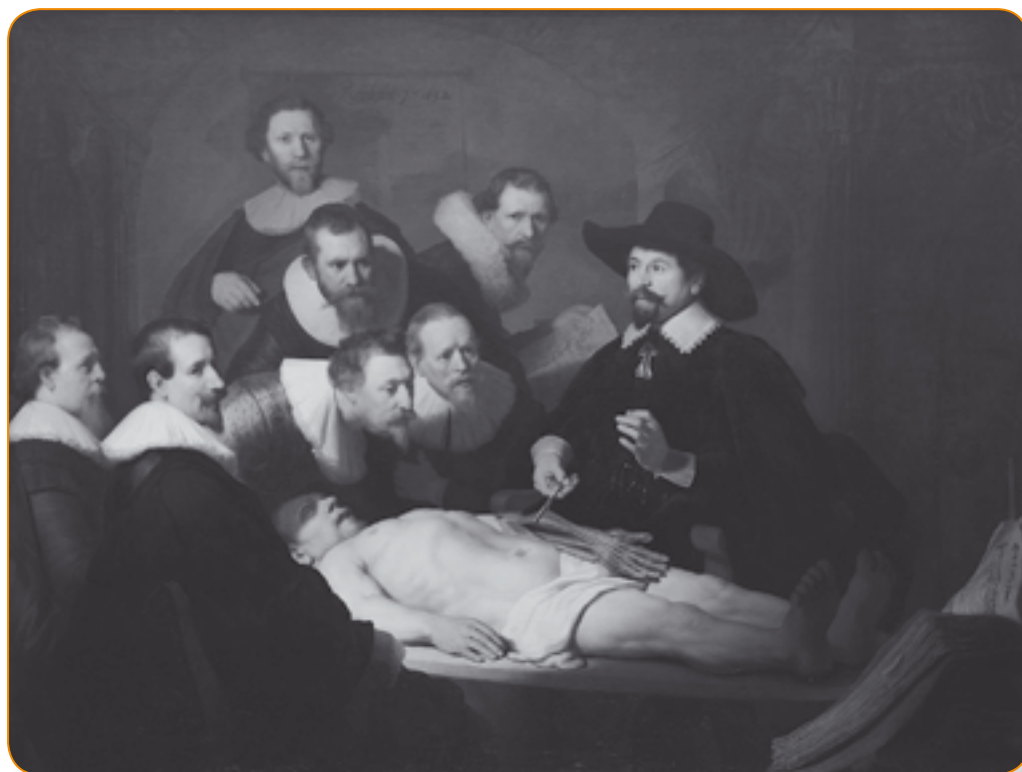
Rembrandt, La leçon d'anatomie du docteur Nicolaes Tulp , 1632.