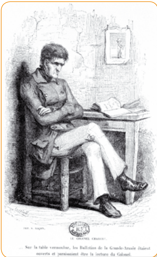
Gravure de Bertall, Illustration pour Le colonel Chabert de Honoré de Balzac .

Cette disparition du colonel Chabert est manifeste à la fin du roman puisque lui-même ne se reconnaît plus dans ce nom qu'il a tant revendiqué. La phrase qu'il prononce devant son épouse « Je