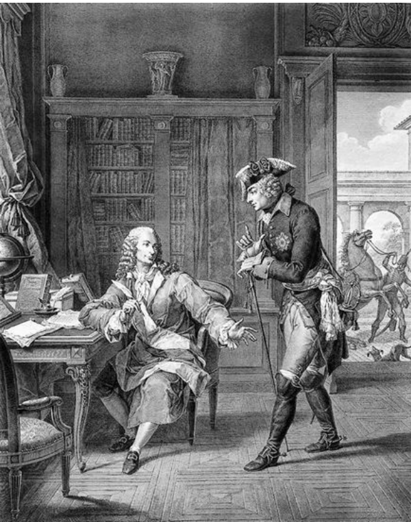
Voltaire à la cour de Prusse chez Frédéric II, roi de Prusse, au château de «Sans-Souci» (environs de Potsdam, vers 1750), par Adolph Friedrich Menzel (1815-1905). Musée de Berlin.