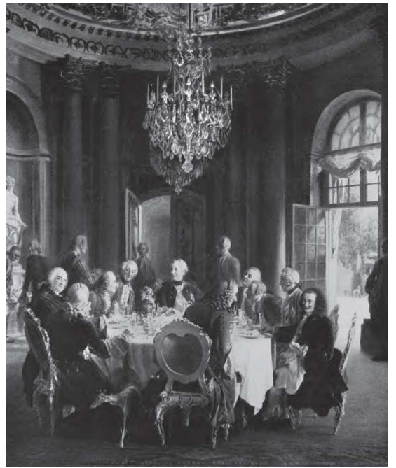
Voltaire recevant la visite de Frédéric II (durant son séjour en Prusse entre 1750 et 1753)