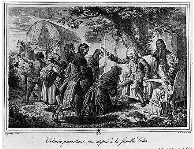
Voltaire promettant son appui à la famille Calas.

J'ai dévoré, mon cher ami, le nouveau mémoire de M. de Beaumont sur l'innocence des Calas; je l'ai admiré, j'ai répandu des larmes, mais il ne m'a rien appris; il y a longtemps que j'étais convaincu; et j'avais eu le bonheur de fournir les premières preuves [ ... ] Sur la fin de mars 1762, un voyageur qui avait passé par le Languedoc, et qui vint dans ma retraite à deux lieues de Genève, m'apprit le supplice de Calas, et m'assura qu'il était innocent. Je lui répondis que son crime n'était pas vraisemblable, mais qu'il était encore moins vraisemblable encore que les juges eussent, sans aucun intérêt, fait périr un innocent par le supplice de la roue [ ... ] Je fis réflexion que le père avait été condamné au supplice comme ayant seul assassiné son fils pour la religion, et que ce père était mort âgé de soixante-neuf ans. Je ne me souviens pas d'avoir jamais lu qu'aucun vieillard eût été possédé d'un si horrible fanatisme. [ ... ] Cette idée me fit douter d'un crime qui d'ailleurs n'est guère dans la nature [ ... ] Loin de croire la famille Calas fanatique et parricide, je crus voir que c'étaient des fanatiques [Qui a une passion aveugle pour une religion, une doctrine et le manifeste souvent par des actes de violence] qui l'avaient accusée et perdue [ ... ] Voltaire, Correspondance, Mélanges philosophiques , VI, p. 307-318».