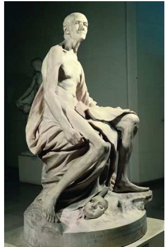
Voltaire, écrivain français, représenté nu, à l'âge de 74 ans. Ronde-bosse en marbre (1776) de Jean-Baptiste Pigalle. (Musée du Louvre, Paris.)

« A l'origine de la création d'une statue en pied (d'autres portraits de l'artiste avaient été réalisés en buste par Houdon), se trouvent dix-sept intellectuels des Lumières dont Denis Diderot et Jean Le Rond d'Alembert ; en 1770, une souscription est lancée. De nombreuses personnalités tel que Frédéric II de Prusse, en qui Voltaire vit un temps l'incarnation du Monarque éclairé, y participent. La République des Lettres érige le philosophe comme l'un des plus grands génies de l'Histoire par le biais de la statuaire publique ; ce privilège, alors exclusivement réservé aux rois et héros de guerre, sublime le Génie. En effet, les représentations des plus grands philosophes antiques ont été immortalisés par le biais de la sculpture ; créer une statue en pied situe Voltaire et, par la même occasion, la France en tant qu'héritière de la culture antique, alors idéal à atteindre.