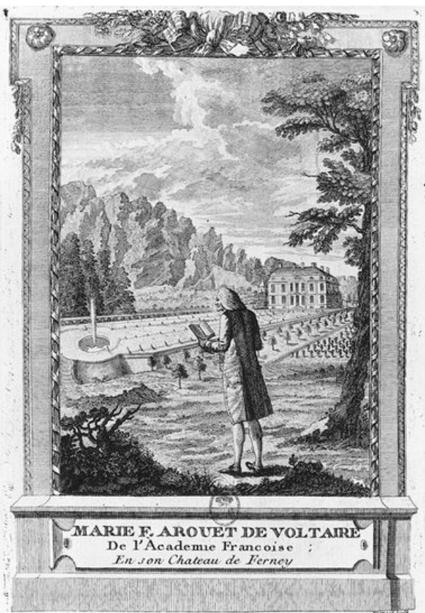
MARIE F. AROUET DE VOLTAIRE De l'Académie Française En son Château de Ferney

Le café Procope est un des plus anciens, cafés-restaurants de Paris (fondé en 1686) . Il se situe au 13, rue de l'Ancienne-Comédie, dans le 6e arrondissement. Il est également accessible par le passage de la Cour du Commerce-Saint-André. Café d'artistes et d'intellectuels, il était fréquenté au XVIIIe siècle par Voltaire, Diderot et d'Alembert. Centre actif durant la Révolution française, il reste longtemps un lieu de rencontre d'écrivains et d'intellectuels (Musset, Verlaine, Anatole France), d'hommes politiques (Gambetta) et du « Tout-Paris ».