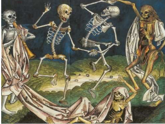
Moyen âge, danse macabre.

Fait les pleurs de la nuit, répandus sur le thym, Lorsque du jour vermeil elle pleure l'absence, Désire son retour, et cherche sa présence, De même Madeleine en cette obscurité (Pendant que son soleil lui cache sa clarté Et pour un peu de temps la prive de ses charmes) Arrose sans cesser la terre de ses larmes. Enfin, ayant ses yeux en cette eau tout confits, Se fond, et se confond au pied du crucifix.