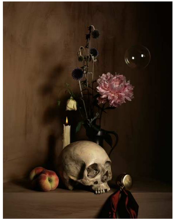
Nature morte à la vanité , photographie de Guido Mocafico, 2007.

Van der Schoor, Vanité (crânes sur une table) , vers 1660