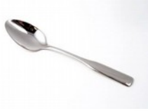
Une cuillère à café