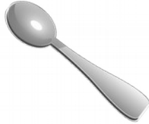
Une cuillère à soupe