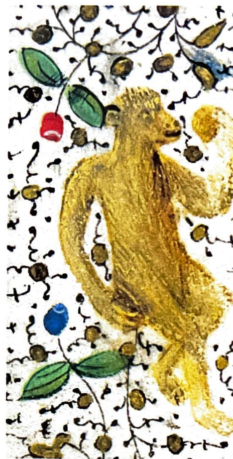
▲ Ce petit singe gourmand est une bordure du Livre d'Heures à l'usage de Nantes (folio 105).

Mais avec l'invention de l'imprimerie au milieu du 15 e siècle, les livres enluminés deviendront de plus en plus rares et seront remplacés par des ouvrages illustrés de gravures. Aujourd'hui les manuscrits enluminés ont trouvé leur place dans les musées ou les grandes bibliothèques et sont une source de renseignements inépuisables sur la vie quotidienne du Moyen Âge.