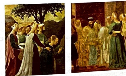
La Reine de Saba (détails).

L'artiste apporte quelques transformations aux vêtements et aux coiffures, à la position des bras de la reine et de sa première suivante, dont il accentue la courbe du cou, mais l'élégance du port de tête, les profils purs et le visage vu de face sont bien les mêmes.