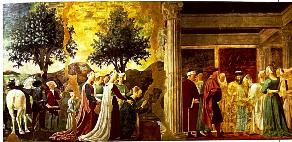
Piero della Francesca, La Reine de Saba ; détail de la fresque L'Histoire de la sainte Croix , 1452-1459. Eglise Saint-François, Arezzo.