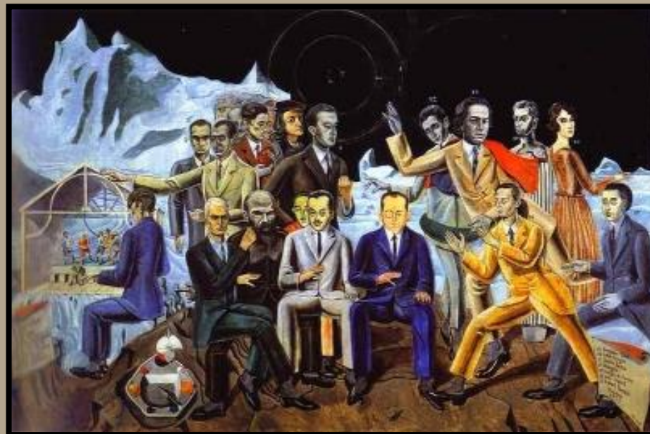
Max Ernst, Au rendez-vous des amis , 1922, huile sur toile, 130 x 195 cm, Wallraf-Richartz Museum, Cologne