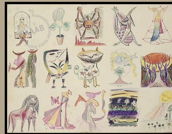
Quinze dessins à l'encre et aux crayons de couleur sur une même feuille. Œuvre collective réalisée à Marseille en 1940. Noms de quelques-uns des auteurs écrits au dos par André Breton ; inscrit également au dos : Marseille 1940 (collectif) A.B.