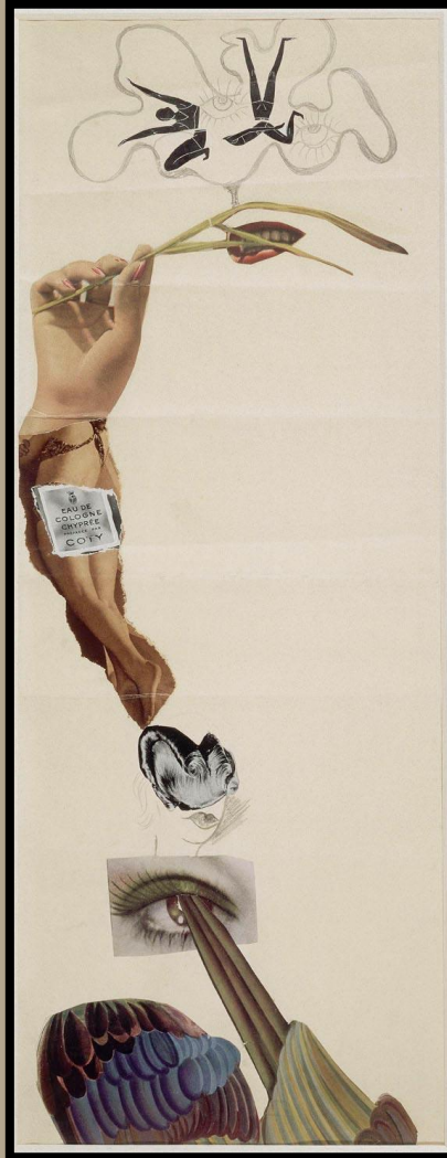
Jean Arp, Oscar Dominguez, Marcel Jean, Sophie Taeuber-Arp, Cadavre exquis , 1937, photomontage, 61,6 × 23,6 cm.

Philippe Soupault et André Breton expérimentent l'écriture automatique avec Les Champs magnétiques (1920). Ils commencent par composer un chapitre chacun pour finir par écrire dans une complète osmose, avançant sans même se relire. Cadavre exquis , le jeu de Marseille , L'un dans l'autre , sont autant de jeux créés par les surréalistes pour éprouver les richesses du collectif.