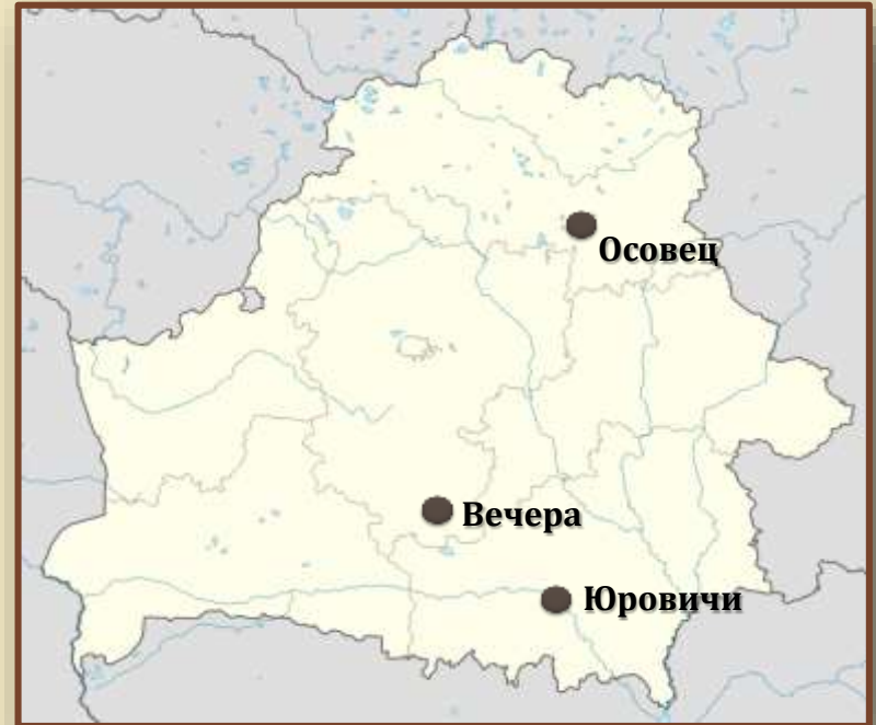
Стоянка у д. Юровичи Калинковичского района