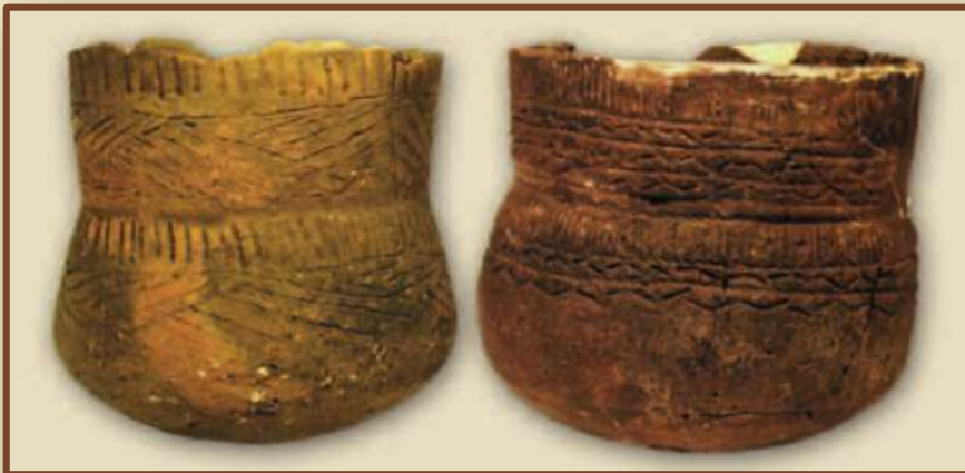
Глиняная посуда бронзового века. Себровичи Чечерского района