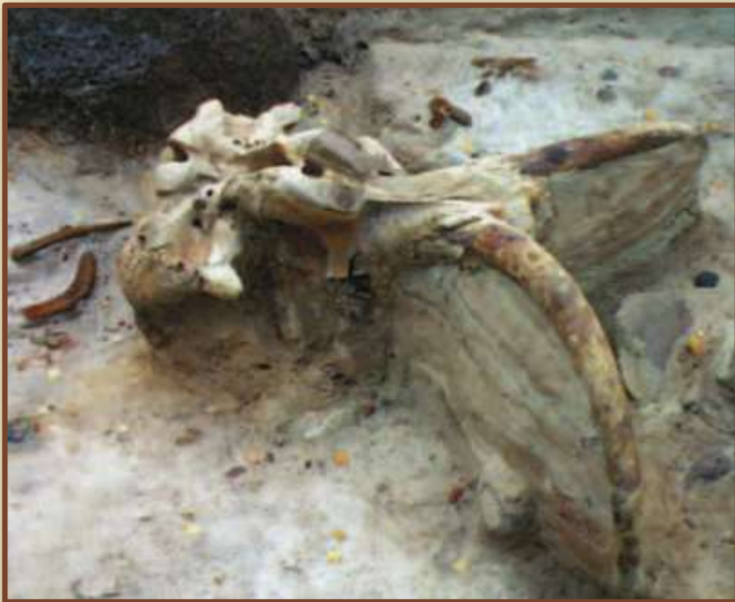
Череп и бивни мамонта. Юровичи

Зарождение искусства на территории Беларуси. Обломок бивня мамонта, украшенный сочетанием зигзагов, шестиугольников и горизонтальных чёрточек, на стоянке в Юровичах. Начало изготовления украшений из зубов животных, раковин, костяных трубочек