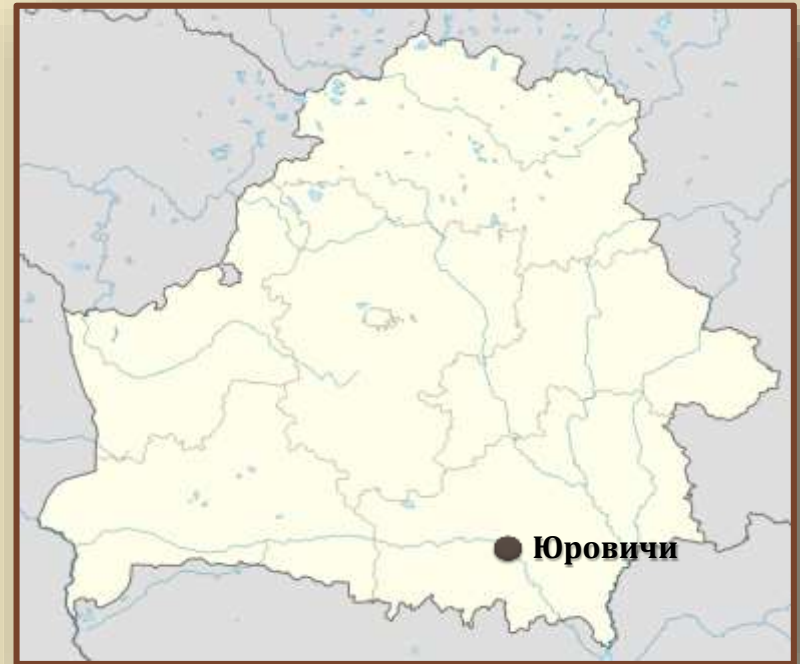
Стоянка у д. Юровичи Калинковичского района