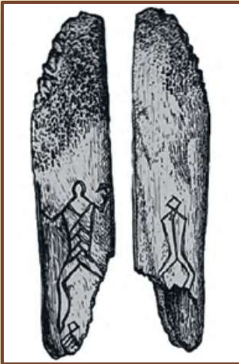
Изображения на кости. Озеро Вечера Любанского района

Появление примитивных изображений человека. Посуда с изображением мужчины и утки в Юровичах. Изображения мужчин на кости из озера Вечера Любанского района. Человечкоподобные фигурки на стоянке Осовец Бешенковичского района. Использование орнамента на керамической посуде.