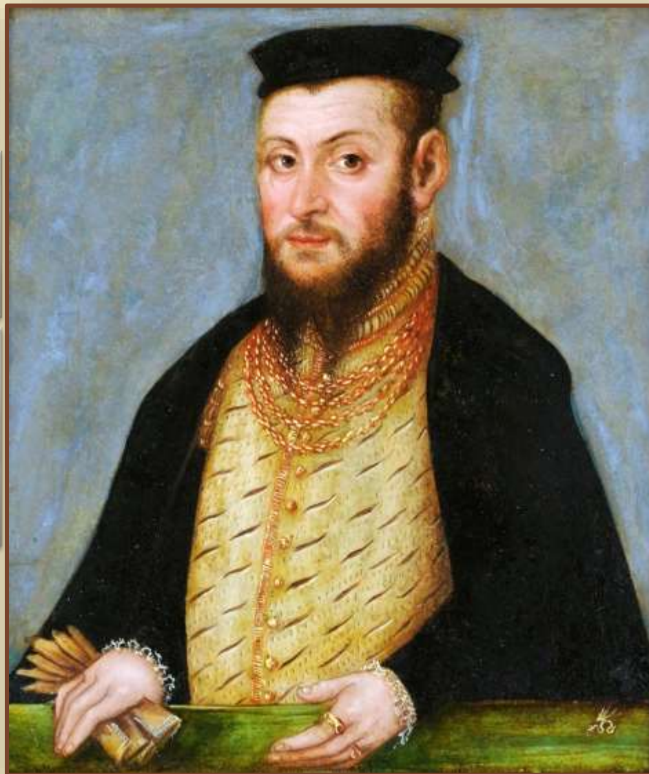
Сигизмунд II Август

Статут 1566 г. – дальнейшая унификация правовых норм, судебных учреждений и административного разделения ВКЛ и Королевства Польского