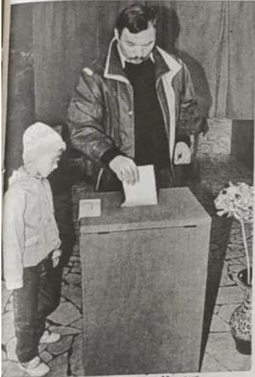
16 мая. Избирательные участки Минска.