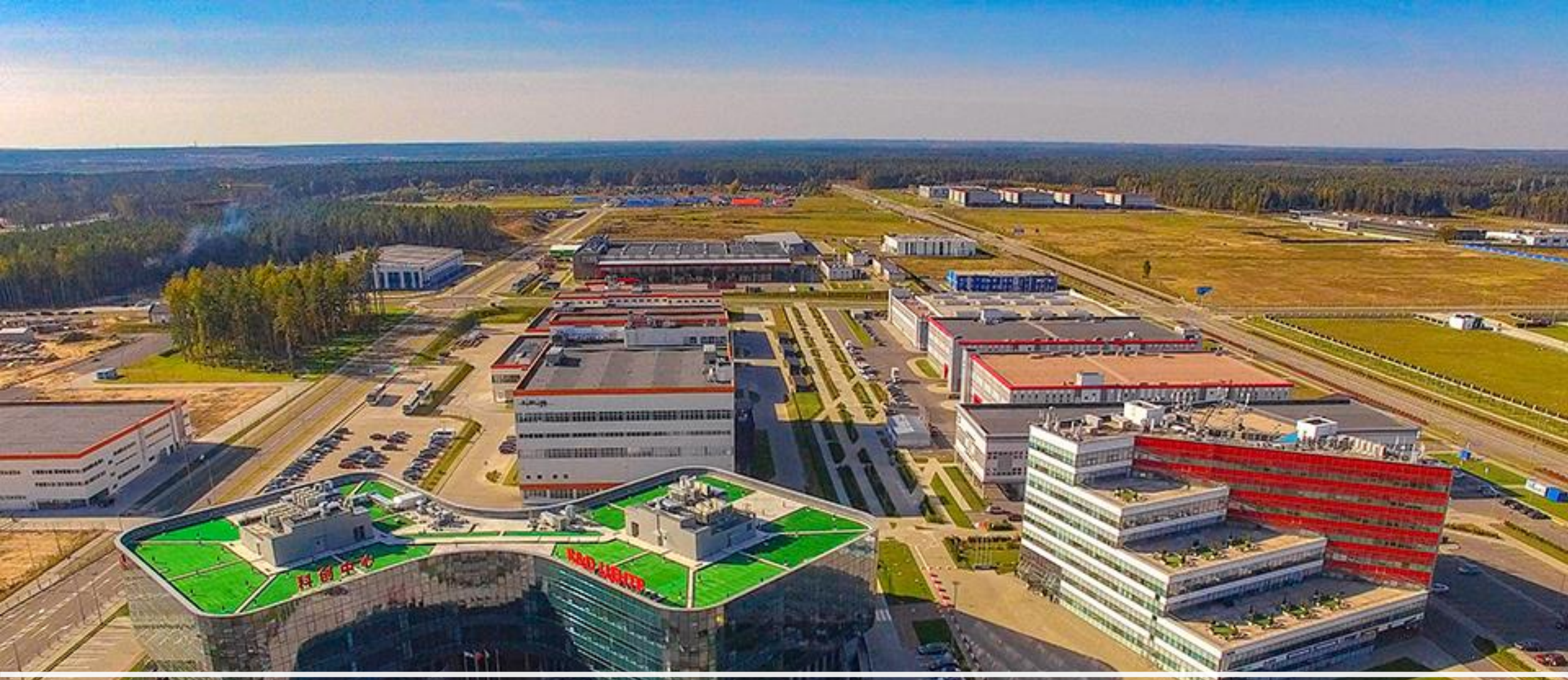
Китайско-белорусский индустриальный парк «Великий камень»