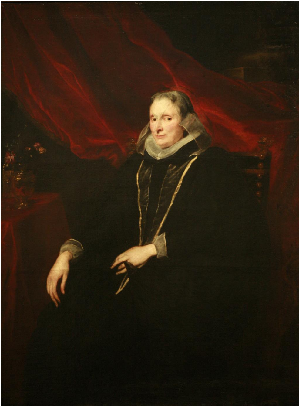
« Portrait d'une dame de la famille Durazzo » d'Antoine Van Dick, vers 1624