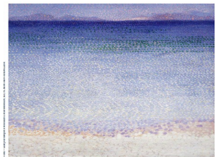
Les îles d'or, Henri Edmond Cross (1892).

→ Montrer aux élèves les deux œuvres et laisser un temps d'observation. A l'oral, inviter les élèves à décrire chacune des deux images