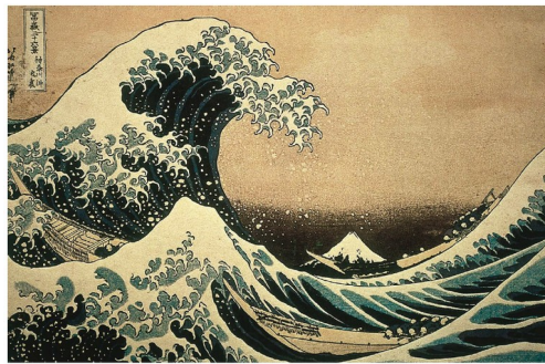
L'arc de la vague au large de Kanagawa, Hokusai (1831-1833).

On peut n'utiliser que la reproduction « L'île » et garder « la vague » pour les pages 9 et 11 du projet d'écriture