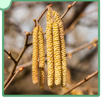
Chaton de noisetier

Pars à la recherche de ces éléments dans la nature et coche ceux que tu as observés.