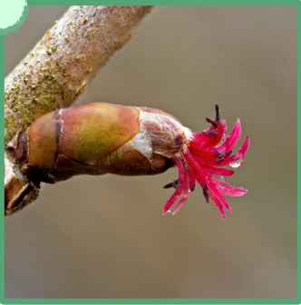
Fleur de noisetier