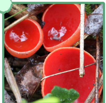
Coupes rouges du Pézize