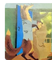
fourrer dans un sac