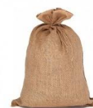
un sac en toile