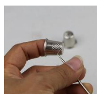
un dé à coudre