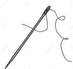
une aiguille enfilée