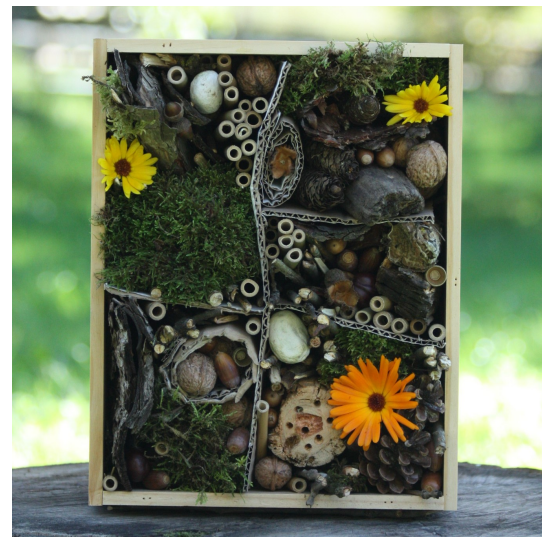
Apprendre en observant