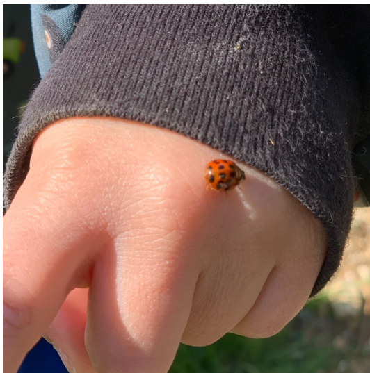
Premières rencontres avec les petites bêtes