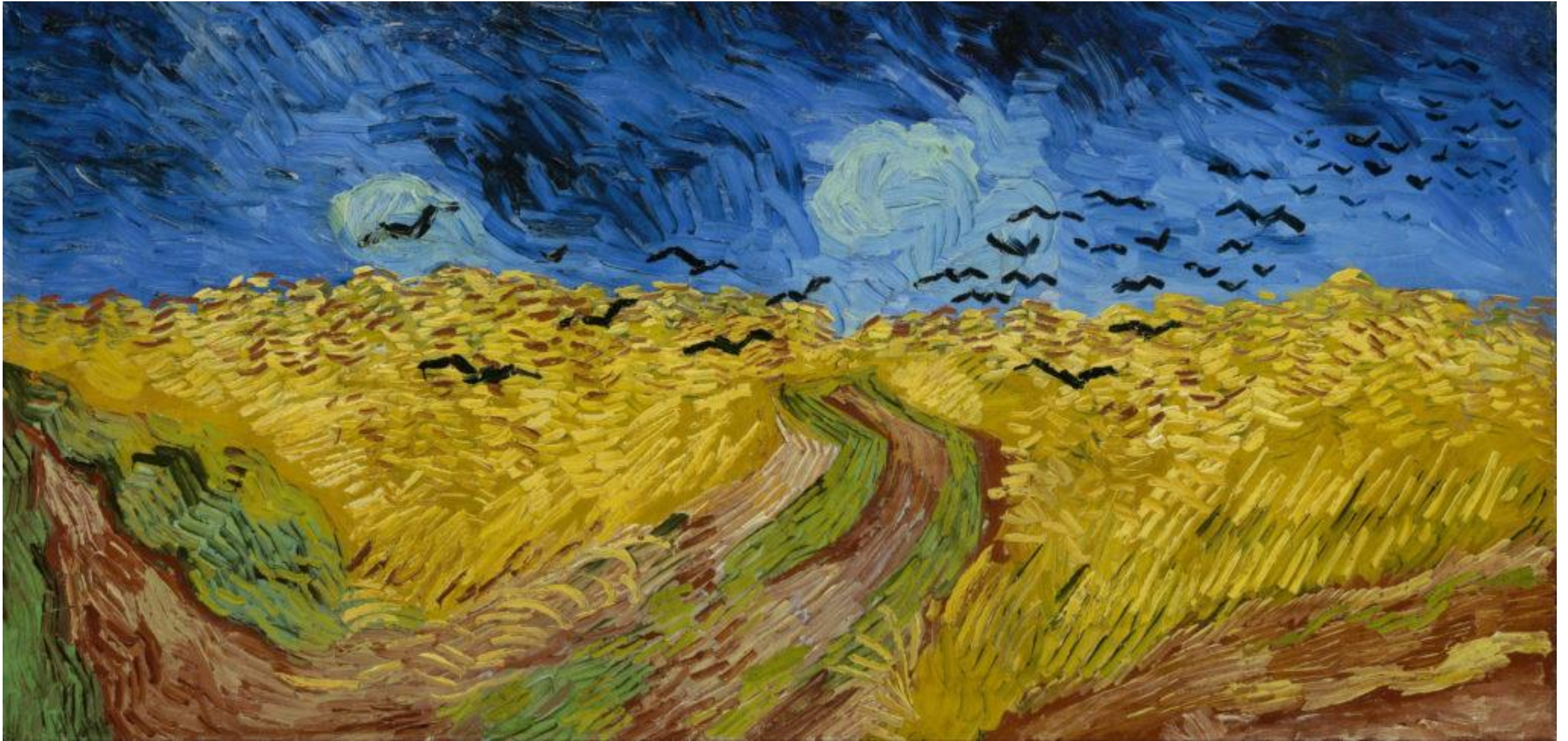
«Champ de blé aux corbeaux» de Vincent Van Gogh, 1890.