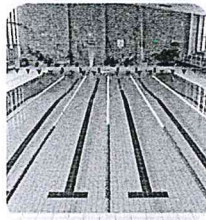
une piscine / un bassin une piscine / un bassin