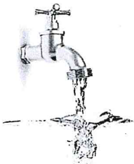
de l'eau de l'eau