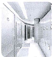
un vestiaire un vestiaire