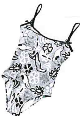
un maillot de bain un maillot de bain