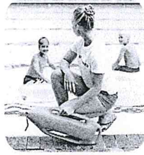
un maître-nageur un maître-nageur