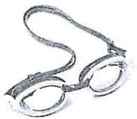
des lunettes de piscine des lunettes de piscine