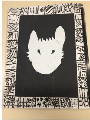
- Loup noir