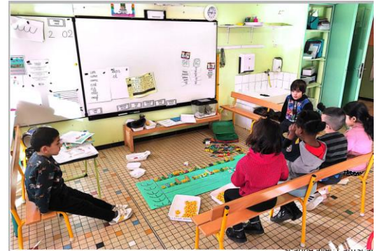
- Petit Poucet