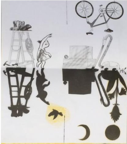
- Les ombres