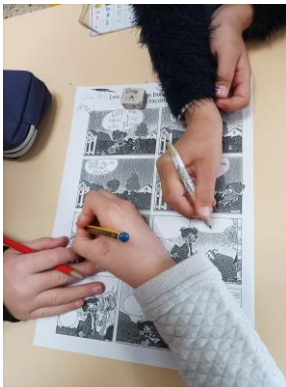
- La BD