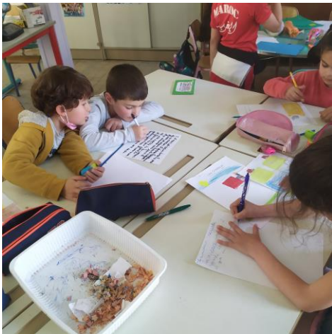
- Les oiseaux