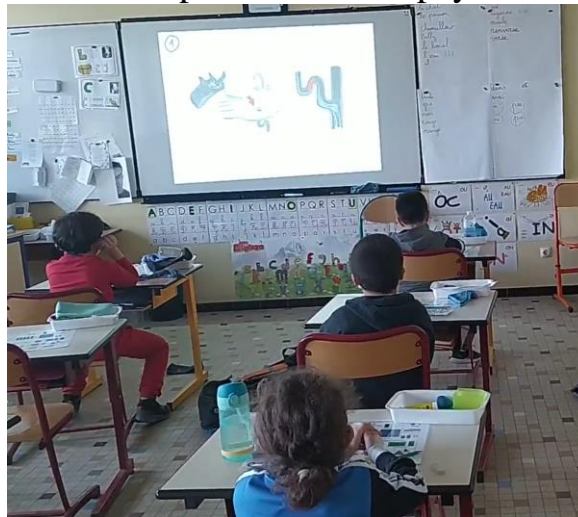
- Petit poisson voit du pays