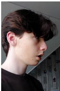
De profil droit

Ces prises de selfies ont été prises sous différents angles de vu (en vue frontale, latérale de côté droite/gauche, en plongée) pour comprendre le modelage approximatif de mon visage. J'ai décidé de donner un aspect dynamique à ma production en adoptant une expression exagérée.