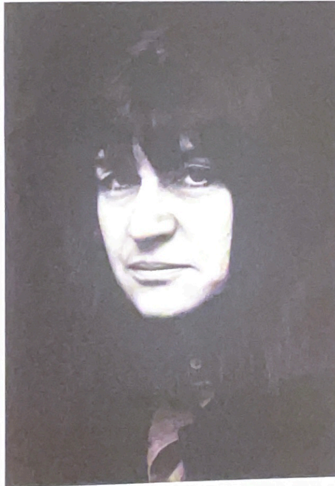
Portrait : Anne Sylvestre

Comment la chanson rend-elle compte de la construction de l'identité genrée et joue-t-elle des stéréotypes masculin/féminin (parfois pour le pire) ou avec eux (pour les mettre à distance ou les déconstruire) ?