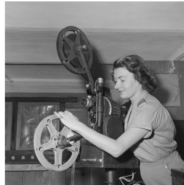
Projectionniste à la section cinéma du service social des FTEO (Forces terrestres d'Extrême-Orient), Indochine, novembre 1951.

Documenter l'histoire des XX e et XXI e siècles tout en analysant le contexte de production des images de l'armée française S'inscrire dans le calendrier mémoriel Participer à une meilleure compréhension de l'action des armées