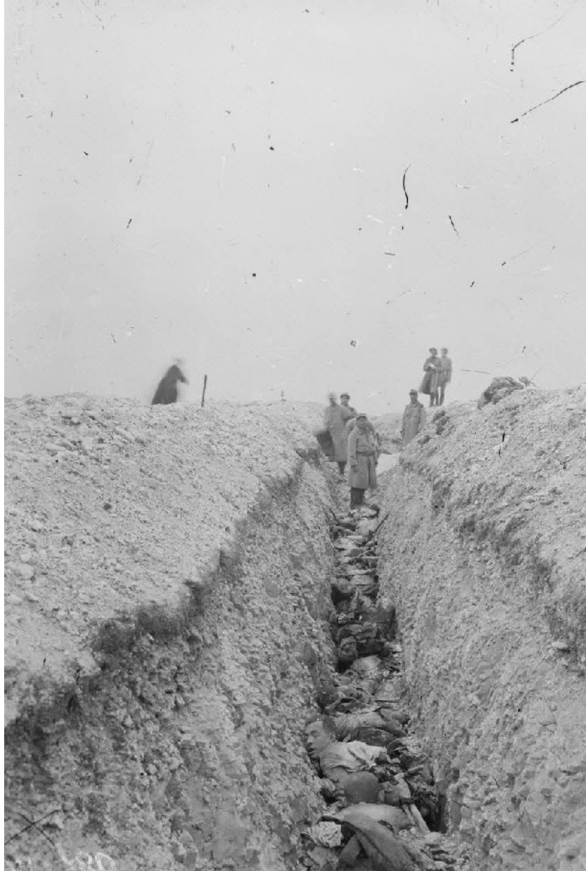
Cadavres allemands à l'ouvrage de Wagram, au nord-est de Souain (23 Allemands au coude à coude). 1 er octobre 1915, Marne.