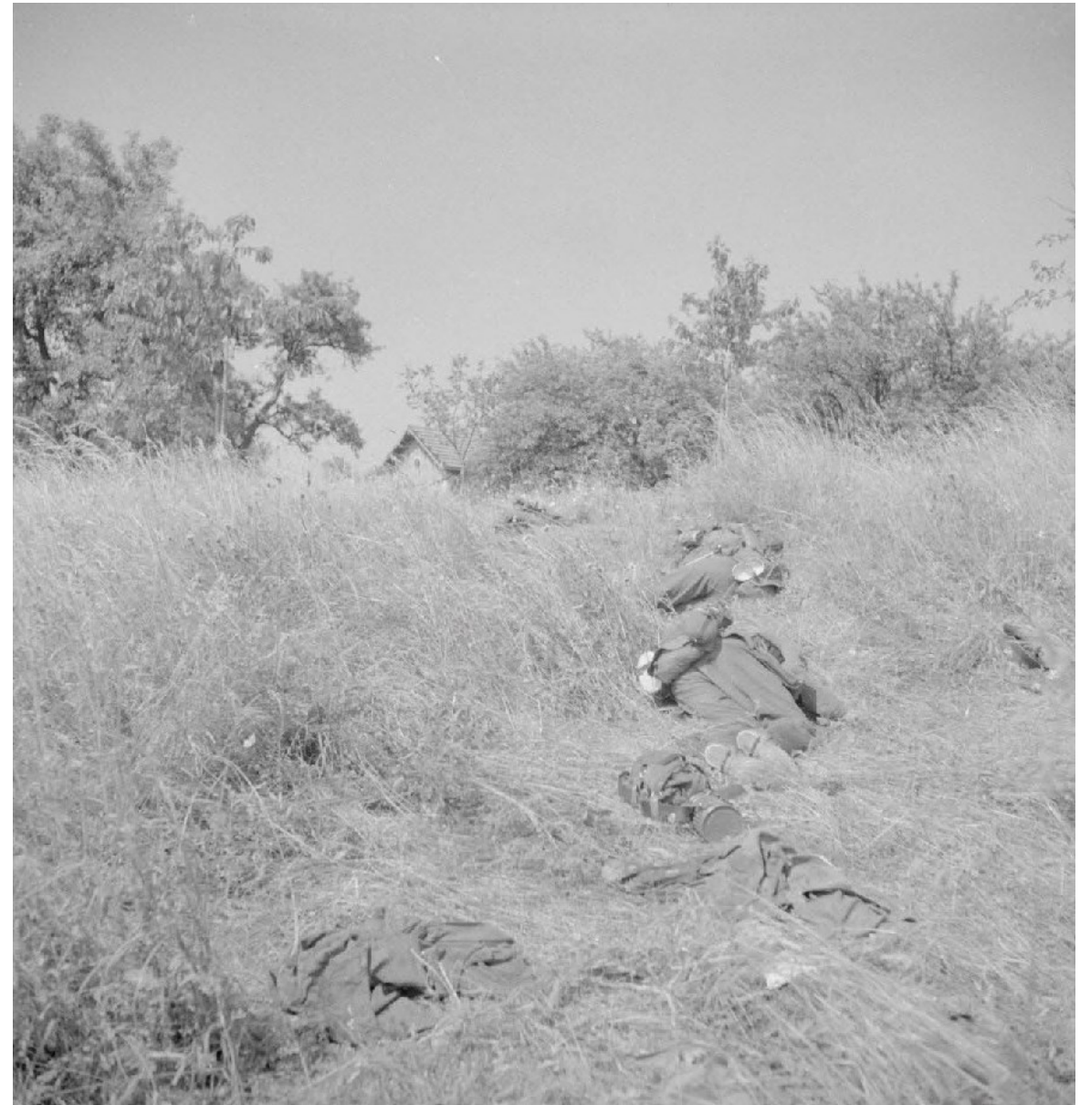
Plan général de cadavres allemands près de la route de Laon. Juin 40. DG 54-755