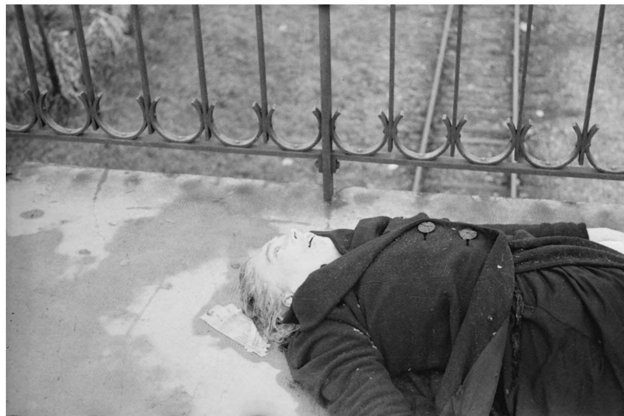
Cadavre d'une femme gisant sur le pont d'Anvers à Strasbourg, photographié par Roland Lennad, photographe du SCA. Novembre 44. J. Belin. TERRE 339-8031