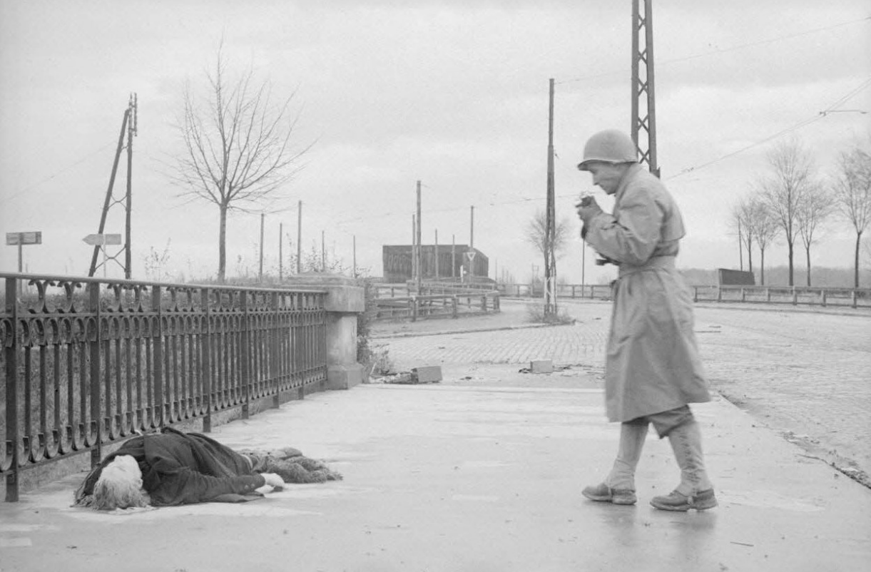
Cadavre d'une femme gisant sur le pont d'Anvers à Strasbourg, photographié lors des combats de libération de la ville par la 2e DB (division blindée). Nov 44. Roland Lennad. TERRE 339-8111