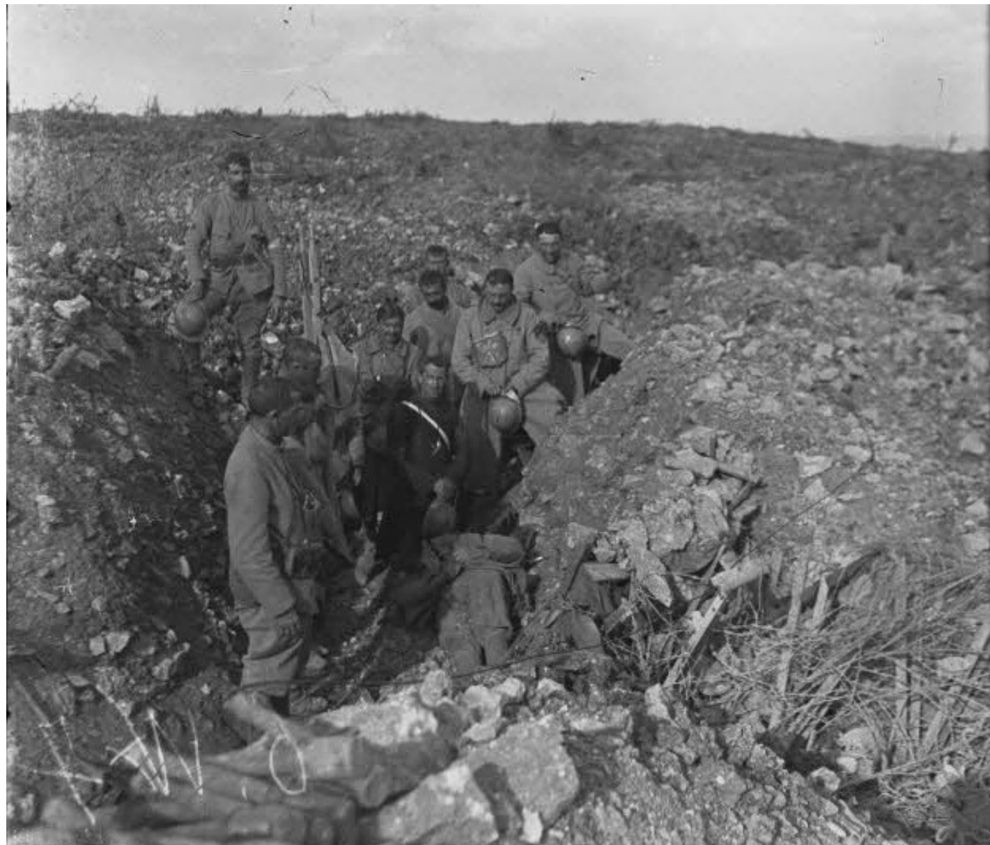
Cote 304, enlèvement de cadavres. Aout 1917. J. Ridel. SPA 21 W 1148