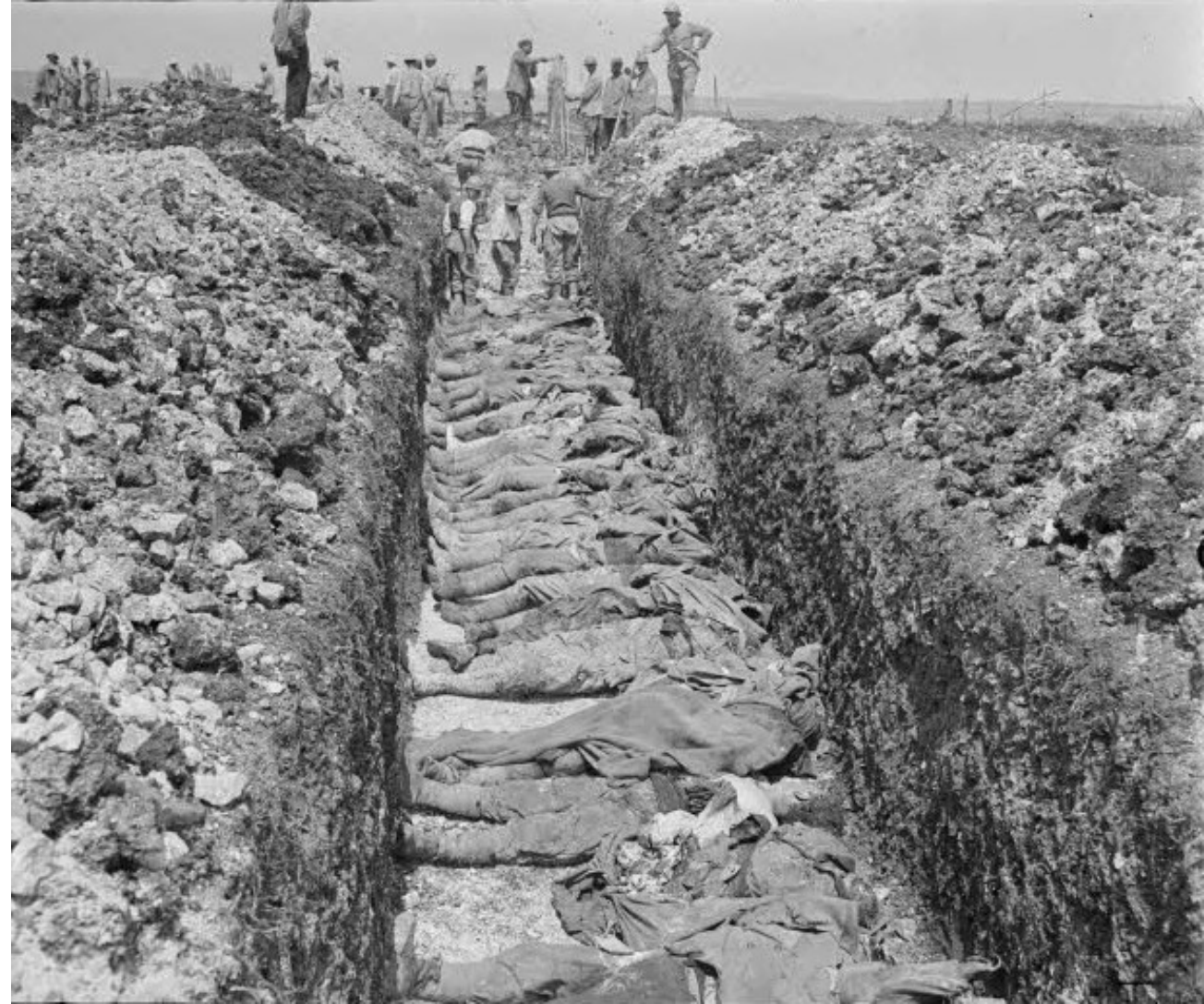
Bois de la Vache (entre Eclusier et Frise). Ensevelissement de cadavres français. 1 er juillet 1916 . Paul Queste. SPA 43 B 3364