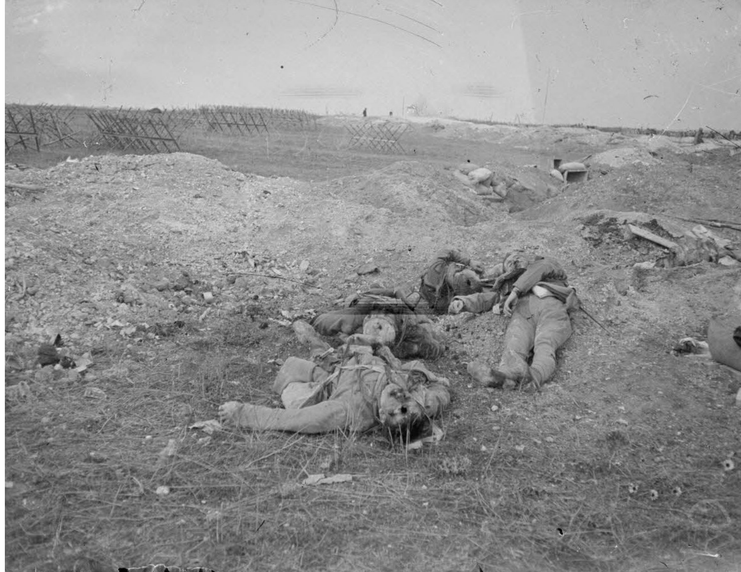
Les anciennes tranchées de 1ère ligne. Des soldats morts au champ d'honneur. [légende d'origine] Octobre 1915, Marne Paul Queste, SPA 19 B 1347

226 photos notées censurées ou interdites