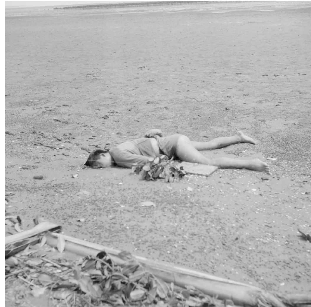
Cadavres de partisans du Viêt-minh après l'attaque du poste de Tho Thuong. Décembre 1953.