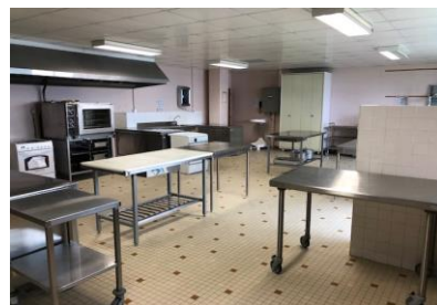
La cuisine pédagogique