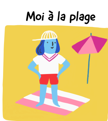
Moi à la plage