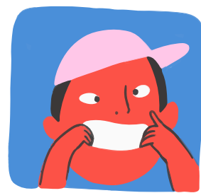
Moi en train de faire une grimace