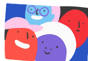
Mes amis et moi