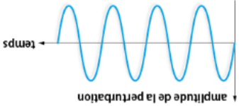
Evolution de la perturbation en un point