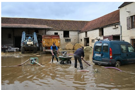
Des agriculteurs nettoient l'eau qui stagne dans leur cour de ferme après les inondations de la rivière Armançon à Aisy-sur-Armançon (Yonne), le 2 avril 2024.

Davantage de pluie en hiver, moins en été ; plus de sécheresses ; des cours d'eau à sec et d'autres plus sujets aux crues... Le programme Explore 2, rendu public le 28 juin, balaie, à travers 72 simulations, les évolutions possibles des bassins-versants du pays.