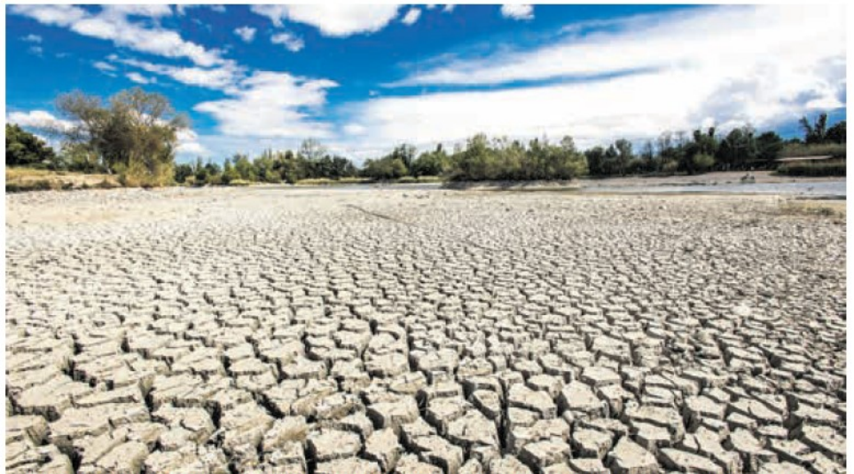
Les périodes de sécheresse plus longues (ici, dans les Pyrénées-Orientales) et les températures anormalement élevées ont favorisé une augmentation de l'évaporation terrestre, avec comme conséquence l'appauvrissement des sols en eau.

Comprendre comment le réchauffement global affecte ce cycle de l'eau est essentiel pour gérer la ressource. Mais acquérir des données fiables est complexe car l'appauvrissement des sols en eau est un mal lent et souterrain, sournois. « Contrairement à d'autres catastrophes naturelles telles que les tremblements de terre et les inondations, les sécheresses se développent plus graduellement , notent les auteurs de l'étude. Elles commencent par des déficits de précipitations, entraînant l'épuisement du stockage de l'eau terrestre, y compris l'humidité du sol, les eaux souterraines et l'eau dans les cours d'eau et les lacs. »