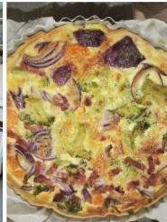
cuisiner chez soi un repas avec des légumes de saison