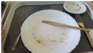
finir son assiette pour éviter le gaspillage alimentaire

Quelques exemples de défis relevés... (preuves à l'appui !) :