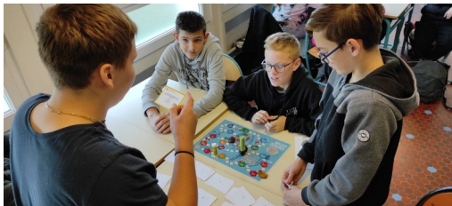
découvrir les objectifs du développement durable en jouant ensemble