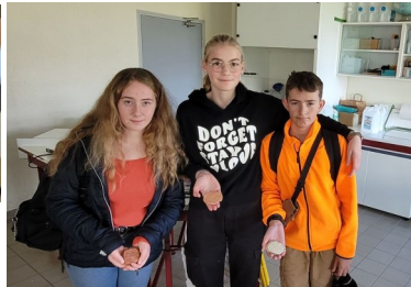
fabriquer son shampoing solide au labo 3 pour limiter l'utilisation du plastique