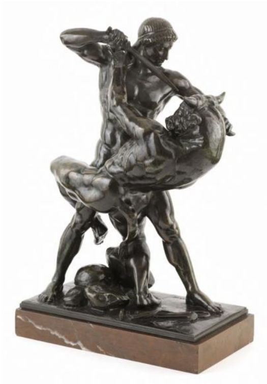
Barye, Antoine-Louis Vers 1843 Sculpture en bronze