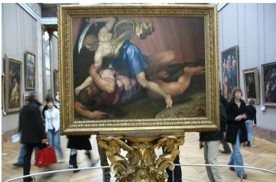
David vainqueur de Goliath 1550 / 1555 (3e quart du XVIe siècle) Daniele Da Volterra