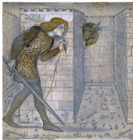
Theseus And The Minotaur In The Labyrinth - Edward Burne-Jones