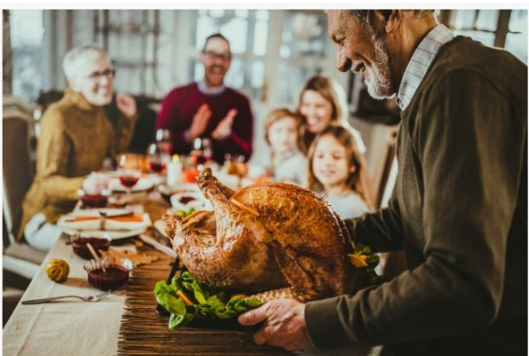
Thanksgiving Day is a federal holiday in the United States.

La veille de Thanksgiving, les associations caritatives distribuent des repas aux personnes sans domicile fixe dans les grandes villes 10 .