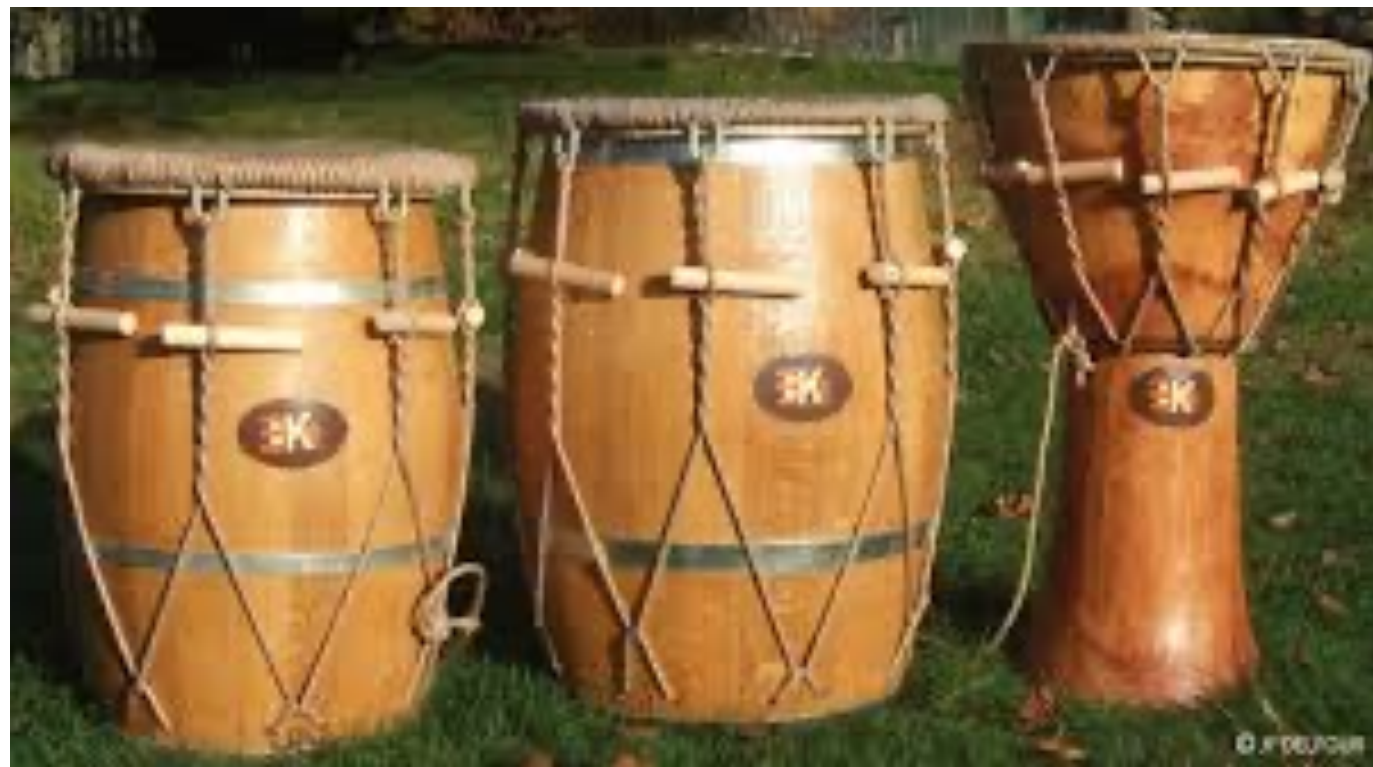
Ka/ Tanbou-ka/ Djembé-ka

Un tambour de facture singulière, élément structurant majeur