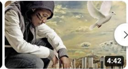
SOPRANO - HIRO FEAT. INDILA (AUDIO OFFICIEL)

B20baOfficiel 🎵 84 M de vues • il y a 6 ans