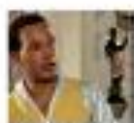
Lieux de mémoire