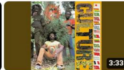
Too Lona In Slavery (2001)