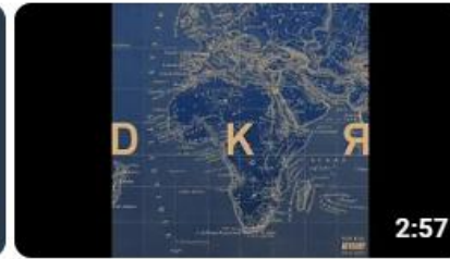
Booba - DKR (Audio)

B20baOfficiel 🎵 84 M de vues • il y a 6 ans