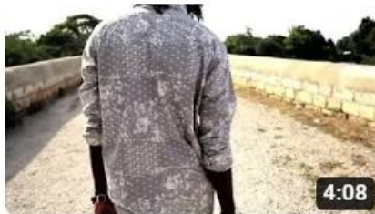
Chronixx - Capture Land