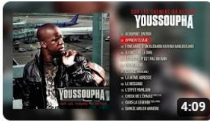
Youssoupha - Apprentissage (Audio Officiel)