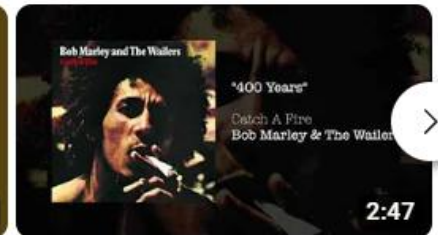
400 Years (1973) - Bob