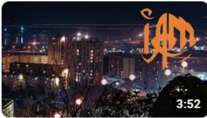
IAM - Tam Tam de l'Afrique (Audio officiel)