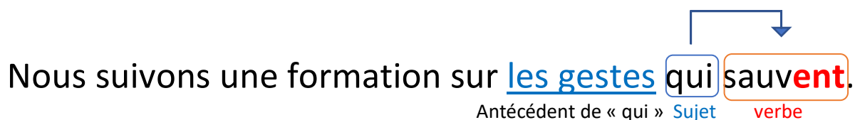
Schéma 3 : Comment accorder le verbe avec le sujet « qui » ?

Astuce : seul le participe présent peut être encadré par « ne...pas ».