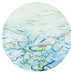
ZAO WOU KI, SANS TITRE, AQUARELLE SUR PAPIER, 2005