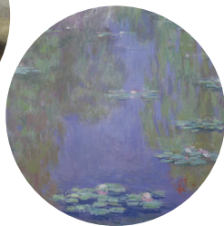
CLAUDE MONET, NYMPHÉAS, HUILE SUR TOILE, 1903