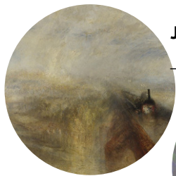
J.M.W. TURNER, RAIN, STEAM AND SPEED, HUILE SUR TOILE, 1844