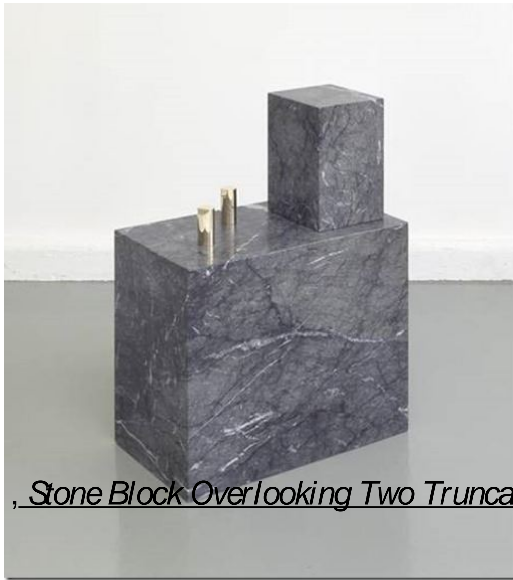
Shahryar Nashat , Stone Block Overlooking Two Truncated Poles , 2009, marbre, bronze,

Shahryar Nashat joue des codes traditionnels de la sculpture et des musées. Il utilise des matériaux nobles comme le marbre, le bronze et continue d'interroger le socle.